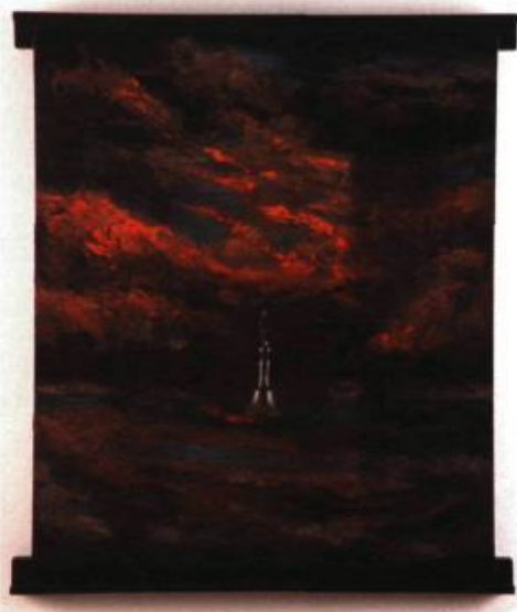
Réal Calder, Ciel – l'appel, 2002. Huile et cloche de cuivre sur panneau ; 100 x 115 cm.