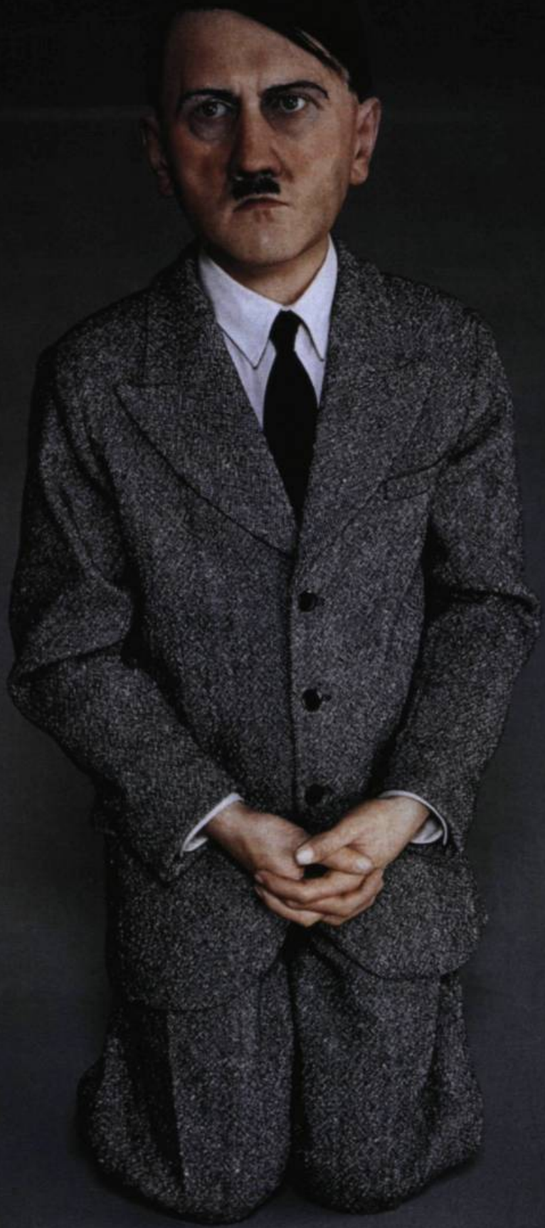
Maurizio Cattelan, Him, 2001. Techniques mixtes, 101 x 41 x 53 cm.