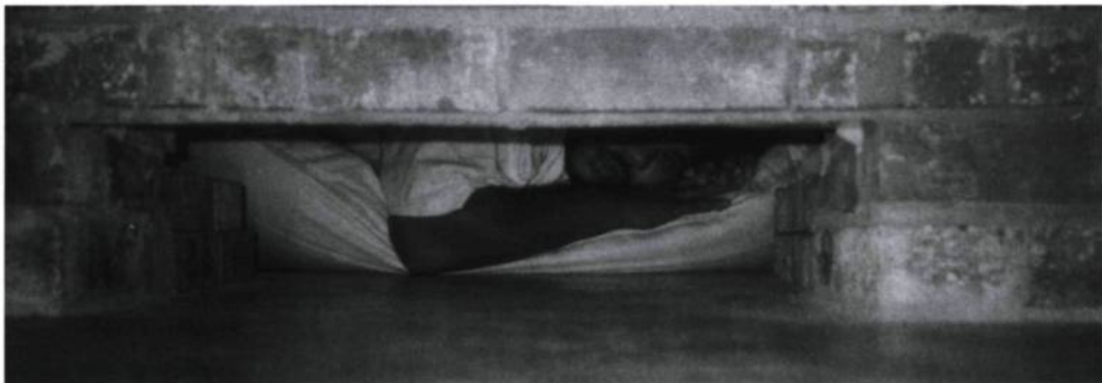
Santiago Sierra, homme rémunéré 10 $ de l'heure, pour rester 360 heures d'affilée (2 semaines), derrière un mur de briques, au Contemporary Art Centre de New York.

fiches créées pour Act Up) par le milieu de la mode, j'avais le sentiment que le vrai engagement résidait ailleurs que dans l'art. Exclusion définitive de l'art du domaine de l'engagement ?