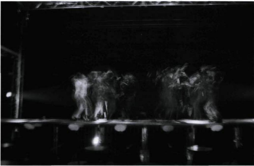
Répétitions de Zulu Time , Usine C, Montréal, juin 2002.