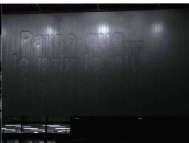
Jean-François Prost, Station Loblaw's, Mur et texte effacé, 2002.

que le mauvais goût, l'absence de spécificité, d'anomalies locales, le contrôle excessif me perturbent. Comment rester insensible à l'environnement sonore (bip des caisses à chaque achat, résonance (voulue) des sons, messages publicitaires à répétition) et à l'environnement climatique autorégulé et sans variations ? Le plus dérangeant dans les lieux génériques, c'est la standardisation, l'homogénéisation des comportements, le manque de fantaisie et de liberté d'expression. Je préfère l'humour et la maladresse des vieux restos le long des routes, décriés et maintenant éliminés au profit des Tim Hortons et autres chaînes.