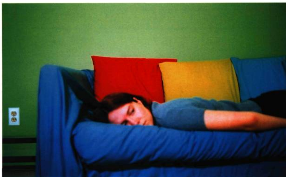
Sébastien Cliche, A Place Where You Feel Safe , série Vivre blessé , 2001. Photographie couleur.

hors de notre contrôle et indissociables de notre condition de mortels, on distingue les imprévus prévisibles venant des autres , dits « chronophages », et les imprévus prévisibles venant de nous . Attribuables à des actes rebelles, à de la négligence ou à des omissions humaines, l'un et l'autre de ces derniers imprévus soulèvent l'épineuse question de la responsabilité voire de la culpabilité, et créent un devoir d'anticipation. C'est dire, en d'autres mots, que l'imputabilité de ce qui nous arrive, en bien comme en mal, nous revient fatalement. Dans l'univers domestique dépeint par Cliche, des gestes quotidiens aussi communs que cuisiner, récupérer, repasser ou même discuter au téléphone sont présentés comme autant de gestes susceptibles d'être la cause de défaillances, d'incidents, voire d'accidents fatals. Il ne suffit plus de se tenir loin de la forêt ou de s'abstenir de prendre un avion pour éviter le pire, puisque la maison recèle aussi ses propres périls : Aujourd'hui la maison tue plus que la route, mais ces accidents ne sont pas inéluctables.