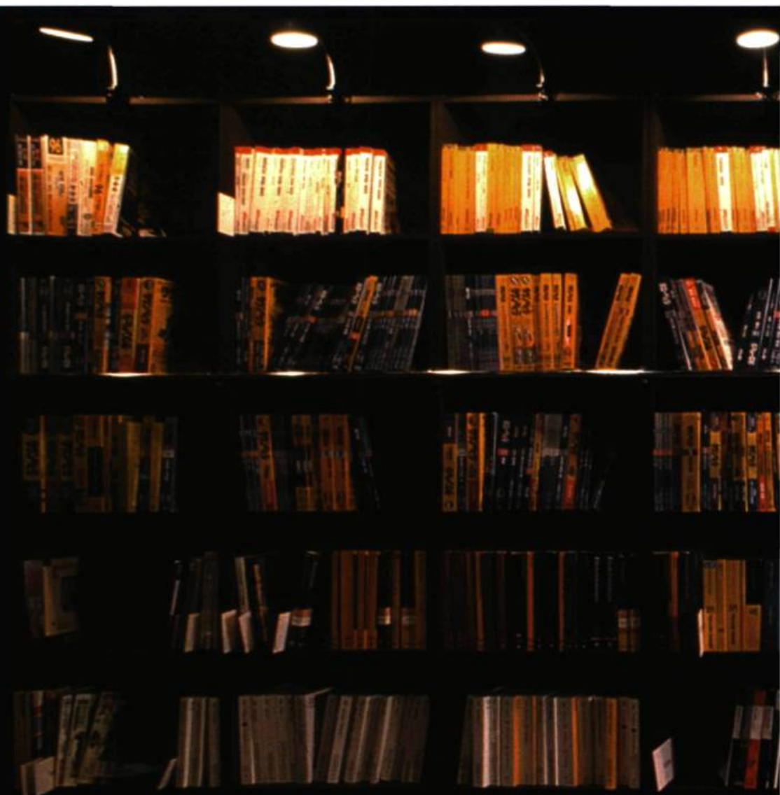
Christian Boltanski, Les abonnés du téléphone , 2000.

Voilà (le monde dans la tête) est présenté au Musée d'art moderne de la ville de Paris et occupe les deux étages d'expositions temporaires. Parce qu'elle n'est jamais innocente, je vais tenter de vous donner une idée de la muséographie mise en œuvre. Je suis au rez-de-chaussée près de la billetterie. Au sol se trouve, mise à la disposition du public, une pile d'affiches. On peut y voir des portraits d'hommes et de femmes. Le titre nous éclaire : Untitled (Death by gun) . Le défunt Felix Gonzalez-Torres, dont nous avons pu à l'hiver 2000 apprécier les bonbons au Musée d'art contemporain du Montréal, nous offre en effet la possibilité de garder en mémoire une infime portion de ces morts par balles américains. Je dis infime portion parce que chaque année, aux États-Unis, plus de