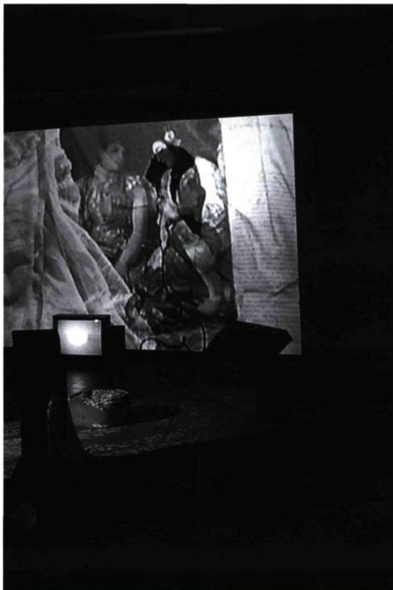
Christine Palmiéri, Néant Compulsif II , 2000. Installation-vidéo (détail).