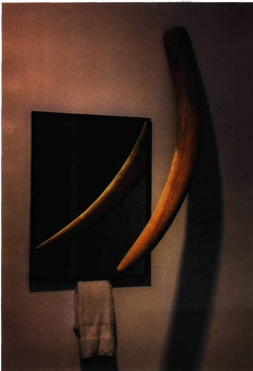
Hugo Vassal, Rire, Rêver, Transpirer , 1999. Bois, miroir, serviette; 1, 5 m x 0, 6 m x 0, 42 m.

cette approche soit pertinente pour le débat muséologique actuel, elle n'est pas dénuée d'ambiguïtés quant aux critères et aux méthodes d'aliénation de l'art contemporain. Cette conception se fonde d'ailleurs sur une chronologie qui s'avère tout aussi aléatoire. En renonçant à transmettre les œuvres dans un autre espace-temps, leur aliénation brise la relation possible avec un passé relativement proche (30-50 ans). Il s'agit de maintenir un « présent perpétuel » où les œuvres ne peuvent être acquises qu'à partir du présent et exclusivement pour le présent.