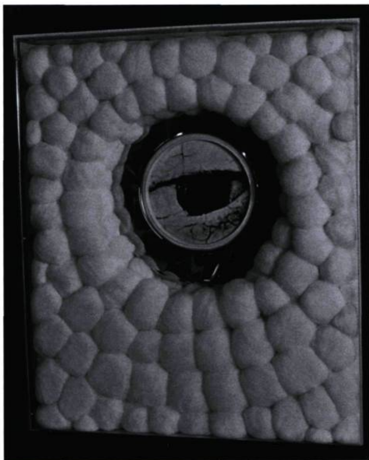
Irene F. Whittome, L'œil , 1970. Sérigraphie, bois, plexiglas, métal, ouate; 63, 5 x 55, 3 x 101 cm. Collection de l'artiste.