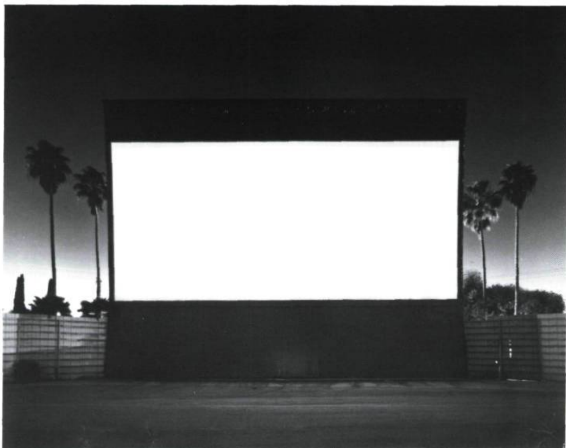
Hiroshi Sugimoto, Rosecrans Drive-In, Paramount , 1993. Photographie, noir et blanc. Édition de 25; 50,8 x 61 cm.

est à la fois un écran idéal et un repoussoir résistant parce que toujours en mouvement, semblable aux écrans de cinéma s'animant durant la projection. Comme si la mer ne vieillissait jamais et qu'en surface ou en apparence, elle était toujours la même, mais aussi chaque fois différente selon le mouvement du jour, le continent où elle sera photographiée... La mer est également un sujet photographique d'une étonnante opacité : insondable, obstacle à la vue, menaçante comme une porte fermée. La mer, comme l'écran de cinéma, est fiction renouvelée dès que notre regard se porte vers elle. Pris par ses mouvements incessants et ses variations subtiles, le regard devient captif de ses miroitements; il oublie que le temps passe. Sorti de son émerveillement, l'observateur constate que le jour tombe.