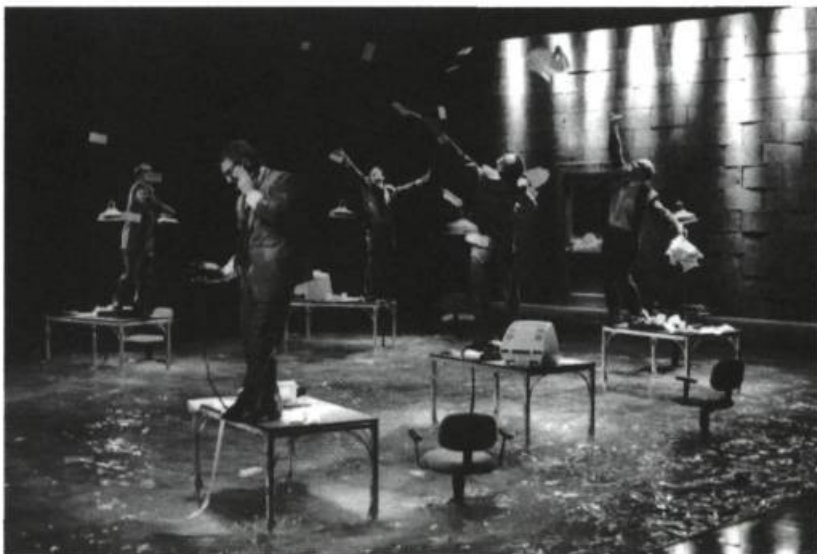
Opium de Lorne Brass.

productions qui aient accordé une égale importance à l'un et à l'autre. Sans endosser forcément une distinction qui me paraît trop fondée sur le sujet par rapport à l'objet, je m'en suis servi comme mode d'approche dans l'examen de quelques productions récentes. Pourquoi pas?