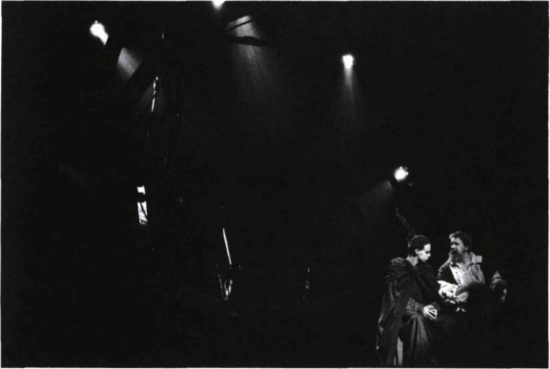
La Vie de Galilée de Bertolt Brecht.

droite, tu viens à gauche; je viens à gauche, tu passes à droite) et n'attendait que peu de fantaisie de comédiens et de comédiennes capables de tout, telle, encore une fois, Françoise Faucher. Même que cette pièce (où on aurait pu centrer l'action sur le fait qu'O'Neill s'y met en scène et en profiter pour moderniser un peu la perspective) chavire complètement dans le mélodrame lorsque la mère, droguée, prend toute la place et que le rideau tombe sur une espèce de mort d'Ophélie où Hamlet aurait complètement perdu le contrôle de l'action. Beaucoup pour l'œil et peu pour l'oreille. Et on sort de la salle en se disant que, avec pareil montage, O'Neill a l'air de finir là où Shakespeare commence. Mais était-ce bien une faiblesse de O'Neill? Ce «voyage vers la nuit» est-il tellement celui de la mère et ses drogues? N'est-il pas d'abord et avant tout le voyage de O'Neill lui-même et de chacun de ses personnages, de celui surtout qui, plus que tout autre, incarne l'auteur sur scène? N'est-il pas, à tout prendre, notre destin, à nous qui assistons impuissants, par l'œil et par l'oreille, à cette représentation d'un voyage au bout de la nuit?