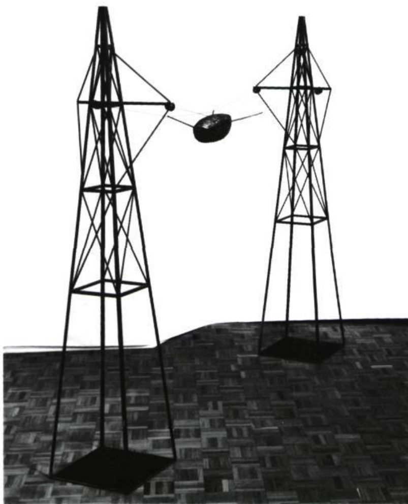
Catherine Widgery, Two Towers , 1989. Acier, cuivre; 191 x 229 x 38 cm

cice d'analyse qui visait à l'introduire au contexte génératif qu'impliquait cette genèse entre l'eau, la terre, l'air et le feu. Trois événements complémentaires formaient l'accrochage. D'abord un dispositif qui suspendait dans l'espace un éventail de récits («livres-puits») et qui reconduisait photographiquement l'itinéraire thématique (tout près au mur, des peintures sur papier développaient l'idée des événements en «documentant», davantage encore, le contexte rhétorique du sujet abordé). Puis, en retrait dans la galerie, une présentation vidéo scénarisait cette fois ce qui fut l'occasion d'une performance-installation tout en reprenant les thèmes centraux de l'exposition. Ces deux premiers dispositifs présentaient des cadres de reformulation (du livre-objet, de la vidéo) qui avaient pour fonction immédiate de fournir un éclairage touchant le processus de création; autrement dit la façon dont les œuvres se sont construites et, parfois même, détruites. Cet itinéraire, résolument didactique, recherchait la compétence des médiums employés et greffait au discours une certaine lourdeur de l'exposé. Ainsi, l'insistance formée par un tel éclairage, ne semblait pas essentiel au spectateur qui aurait opté pour le «plaisir» de reconstruire, s'il le désire, le processus de la fabrication ( Process ).