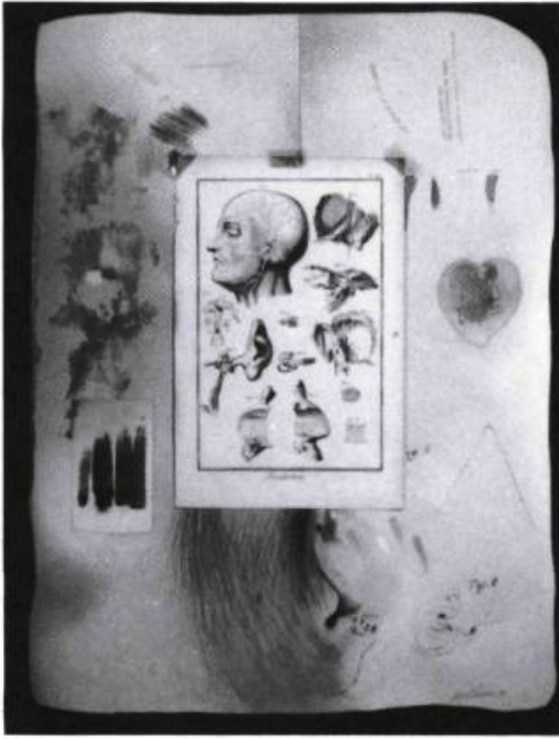
Paul Lussier, Palimpseste baroque #5 fig.8 de l'oreille interne de Vincent , 1990. 80 x 60 cm.