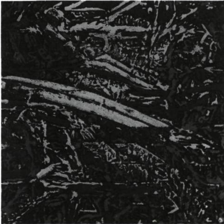
Marcel Saint-Pierre, Next right , 1990. Pellicule d'acrylique sur toile; 153 x 153 cm

le signe d'un espace que notre regard a le loisir de reconstruire ? Un plaidoyer à l'endroit d'une reformulation de l'événement pictural... Puisqu'elle est implicite, la suite est attendue.