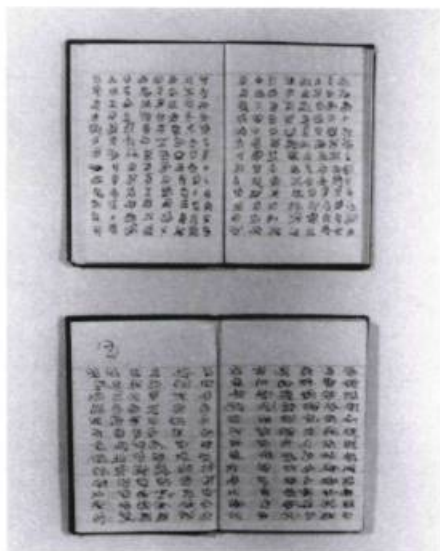
Richard Purdy, La langue écrite de la Culture X , 1987. Encre et gouache sur papier.

Richard Purdy à la galerie Noctuelle, du 12 janvier au 6 février — Deux mots simplement au sujet de cet ambitieux projet dont il a été longuement question dans notre livraison précédente pour confirmer, vérification faite, l'intérêt exceptionnel de cette fabuleuse Histoire