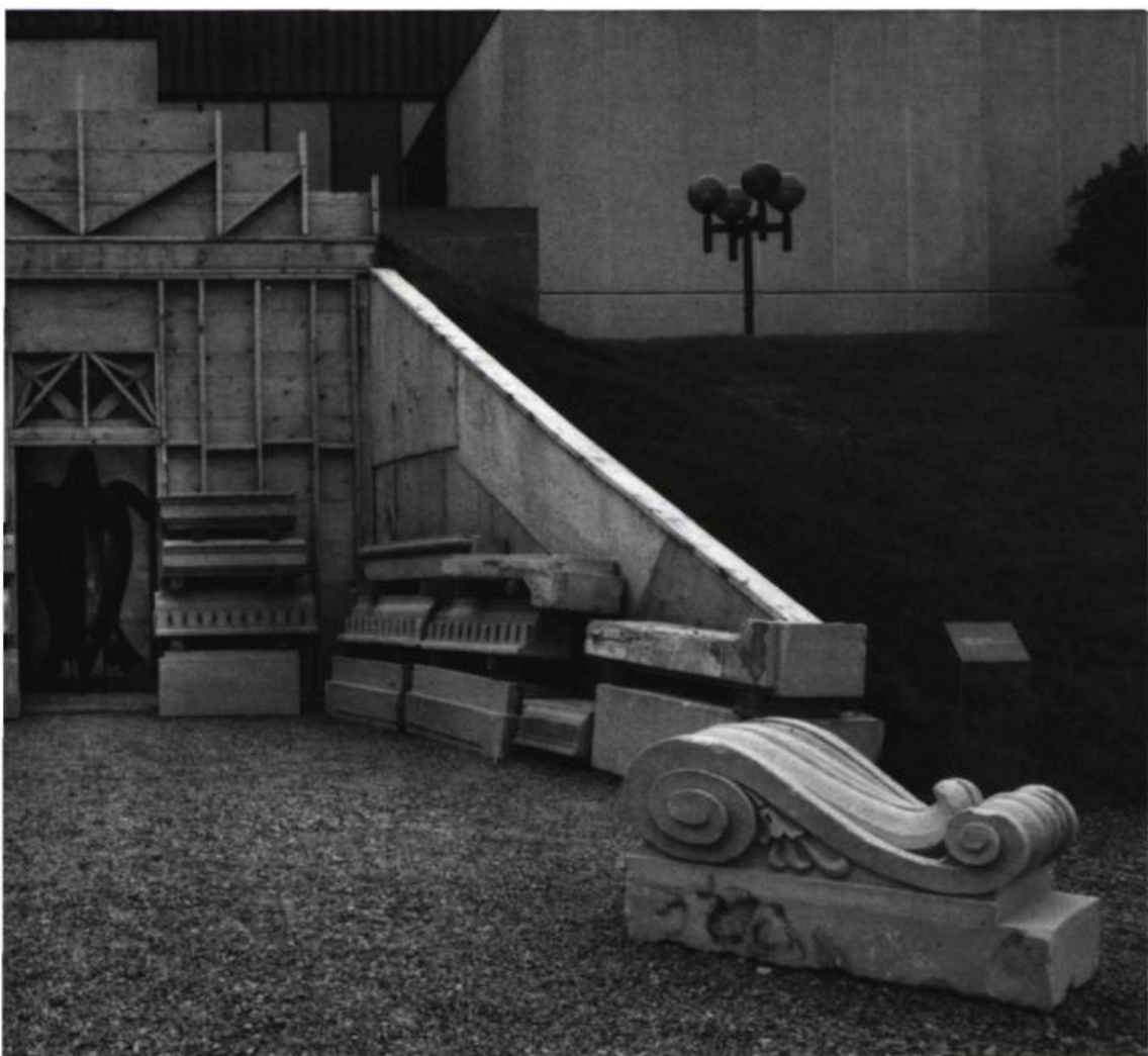
Le Musée des traces, été 1987, au Musée d'art contemporain de Montréal.

Montréal joue un rôle majeur dans le projet actuel du Musée des traces . Le projet a commencé à prendre corps vers le dernier trimestre de 1985. C'est en voyant un champ-cimetière tout à côté de l'actuel Palais des Congrès de Montréal où avaient été entreposés des fragments de pierres provenant de divers édifices qu'il s'est opéré en moi une véritable fascination esthétique; champ de dalles en forme de tombes alignées, sarcophages, mégalithes... Ce champ de remisage illustre ainsi l'expérience du phénomène de destruction urbaine, de l'interférence brutale dans la texture vivante d'un lieu et l'abandon des traces, seuls témoins des qualités de cette texture. Montréal est apparu dès lors comme une inscription originale dans l'espace, un déploiement architectural et humain dont les ordon-