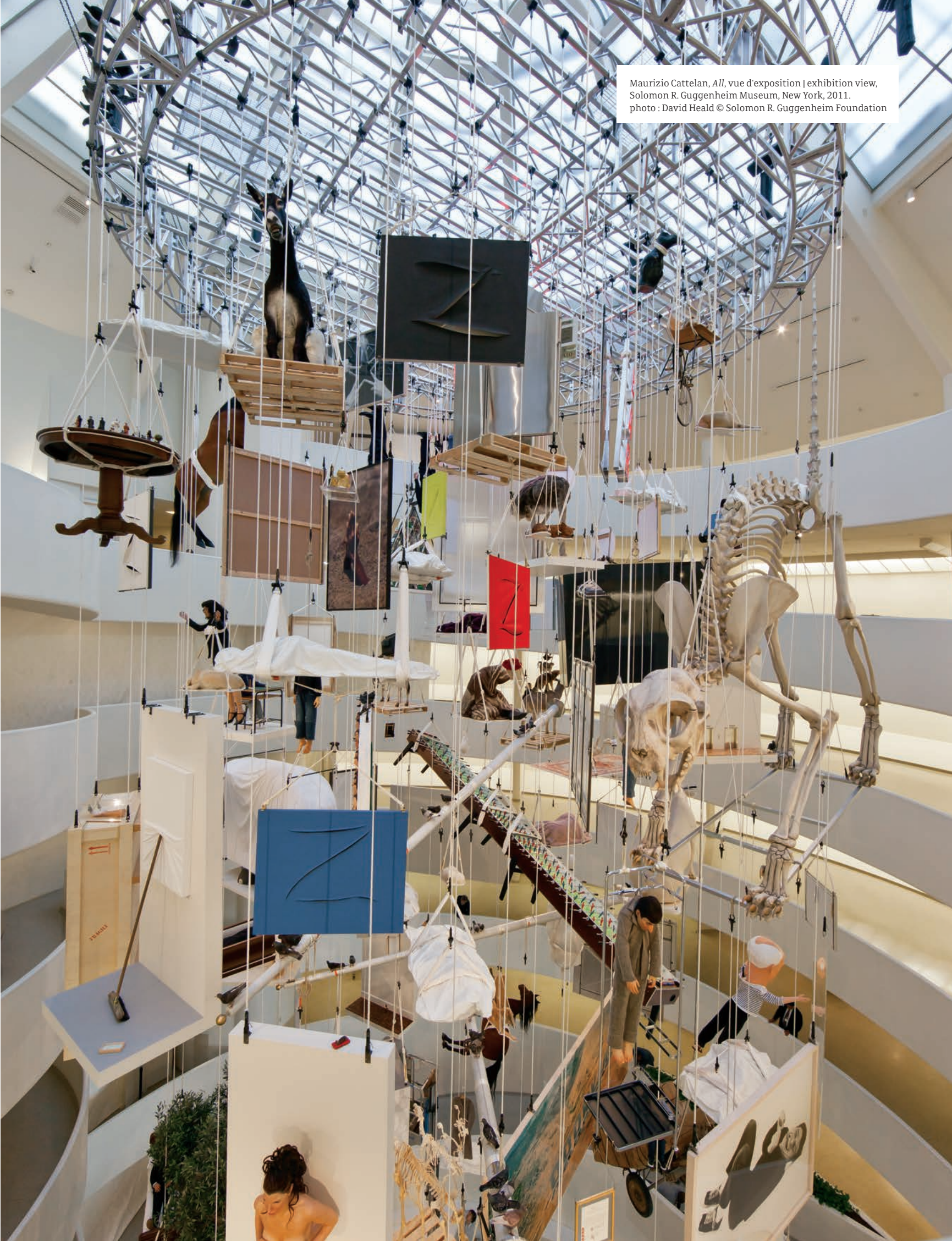
Maurizio Cattelan, All , vue d'exposition | exhibition view, Solomon R. Guggenheim Museum, New York, 2011.