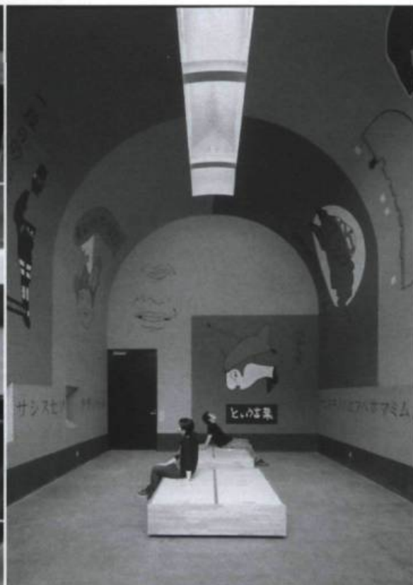
JEAN-MICHEL ALBEROLA, Petite Maison utopique , 2003.

Triennale d'art contemporain d'Echigo-Tsumari 2003 19 juillet-7 septembre Echigo-Tsumari, Japon