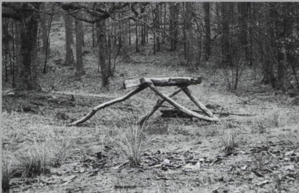
David Nash, Running Table , 1978. Oak, H 152,4 cm. Grizedale Forest, Cumbria, England.

Que ce soit à travers une exploration sensible et une discipline de soi ou de façon plus distanciée dans une mise en évidence de la terre comme écumène, demeure des hommes, part habitable du monde, l'art est largement devenu une « attitude ». Ce qui n'était que tendanciel, à l'époque de la fameuse exposition de Harald Szeemann, est devenu beaucoup plus répandu.