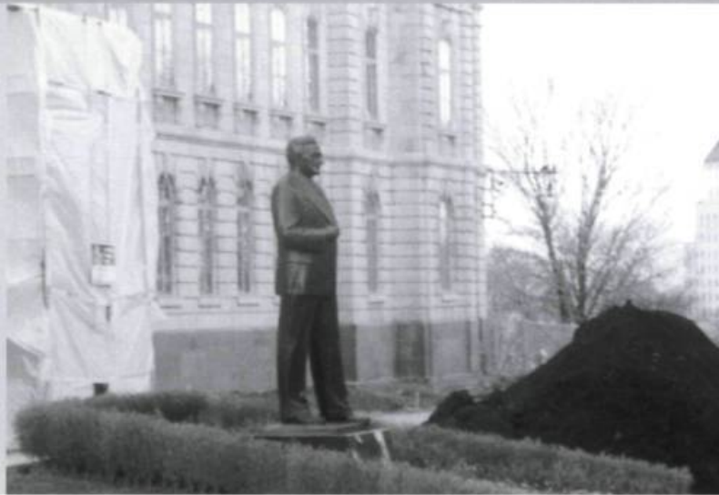
Émile Brunet, Maurice Duplessis , 1959, inauguré en 1977, Assemblée nationale, Québec.