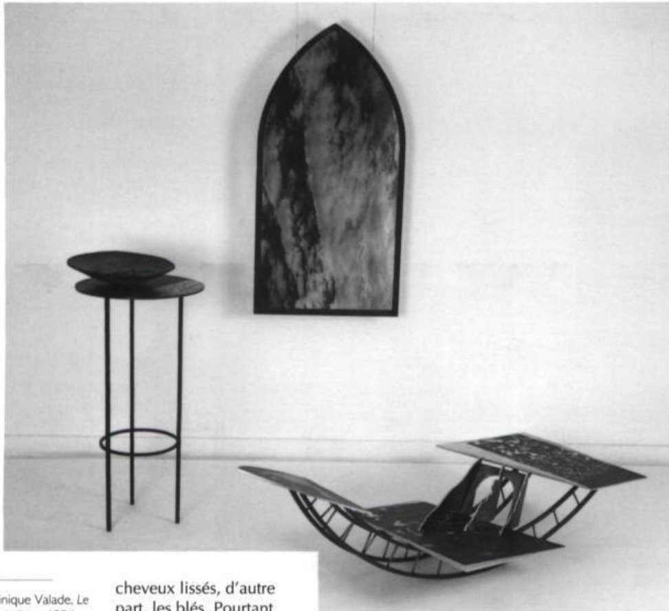
Dominique Valade. Le cours de l'eau , 1994. Acier, aluminium, céramique, fenêtre, film transparent, photographies. 220 x 200 x 200 cm.

Suivant inévitablement le courant, l'humain, l'embarcation et l'eau se confondent à l'intérieur d'une même forme qui repose au sol, dans Le cours de l'eau . Par la photo et le travail en surface, j'exploite quelques qualités esthétiques de l'eau : son opacité, le mouvement du courant (projeté dans la foule), et ses jeux de réflexion (car l'eau regarde et reflète le ciel). La main veinée lie l'eau et l'humain. Tout près, par une fenêtre de forme architecturale gothique, d'où un nuage en transparence est tourné à la verticale, nous pouvons entrevoir la trame d'un paysage urbain réel.