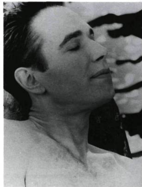
Jeff Koons, film by Tony Knox, 1992. FIFA 1993.

One problem with film and video on sculpture, as presented at Montreal's recent Festival of International Films on Art, is that the screen remains flat. Until some three-dimensional technical advance takes place we are forever locked outside a window, looking in. Film (here also referring to video) controls our eye, and controls our time, not letting us choose or linger except at the filmmaker's discretion. To simply sit and look at art, therefore, is not what the visual media do best. There has to be a story, some thematic hook to draw us in. Films at the festival like La Porte de l'Enfer d'Auguste Rodin and Le Jardin des Ombres (on Quebec architect Ernest Cormier), presented views of sculpture accompanied by chanted poetry or description. These, while high