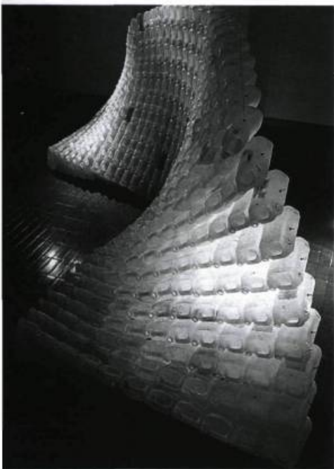
Marie-Josée Laframboise, Mémorial, sculptures , 1993. Galerie d'art du Collège Édouard-Montpetit, Longueuil.

Le contenant a souvent joué le rôle d'objet sacré. Dans les cultures asiatiques et précolombiennes il accompagne le mort, chez les Anciens il gardait le liquide offert aux dieux, dans bien des religions de l'Occident