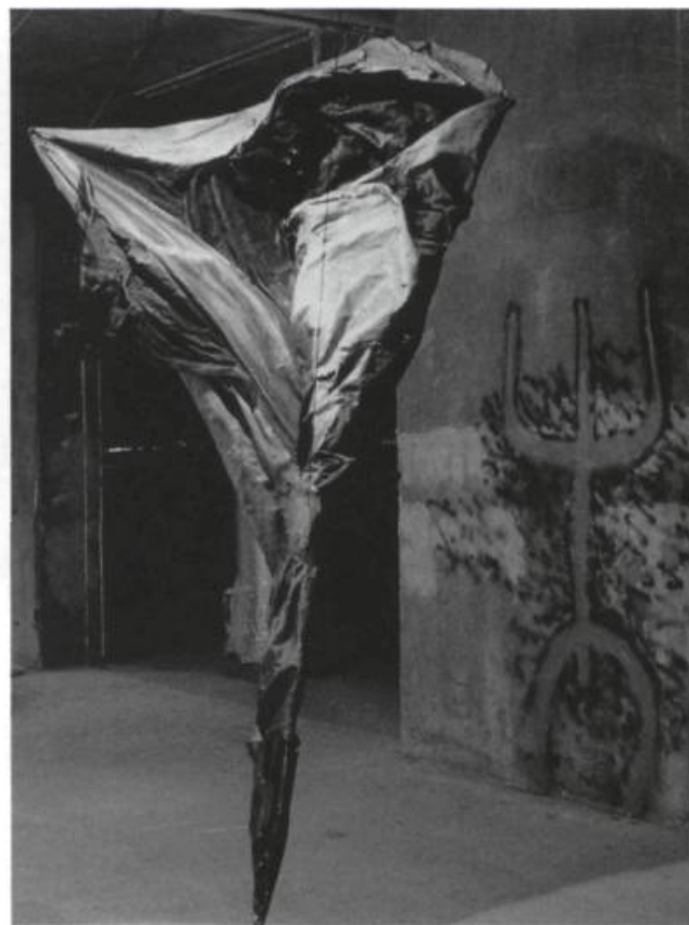
Alain Vaugier, Canyon , 1990. Fibre de verre, toile, acrylique. H : 3,60 m. Sur le côté opposé est reproduit un pétroglyphe Anasazi représentant un labyrinthe qui conduit au centre de l'univers.

Le vaisseau , pièce maîtresse de ces "Sauts