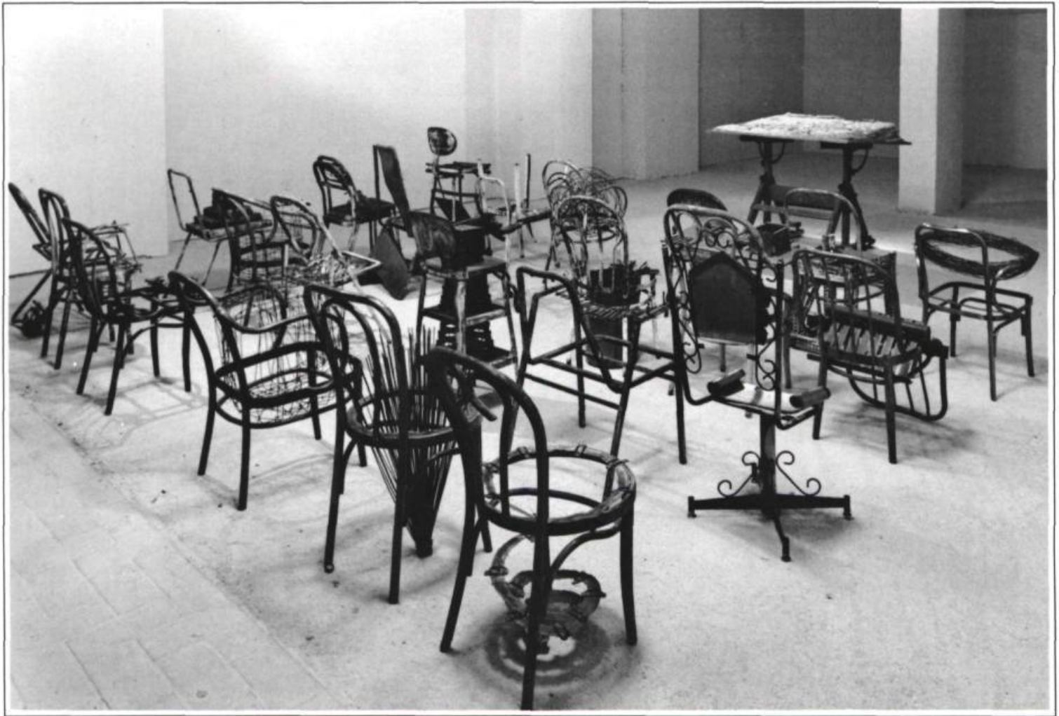
Goulet Michel, Assemblée , 1987. Acier, casse-tête, objets divers. 7 x 7 m. Collection Laurel et Normand Laliberté.