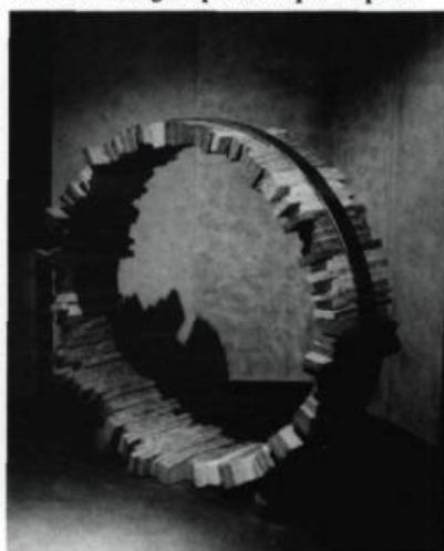
Jean Brillant, Le cercle de la vie , 1989. Granite, acier. Diam. : 9'

Traduit de l'anglais par Monique Crépault.