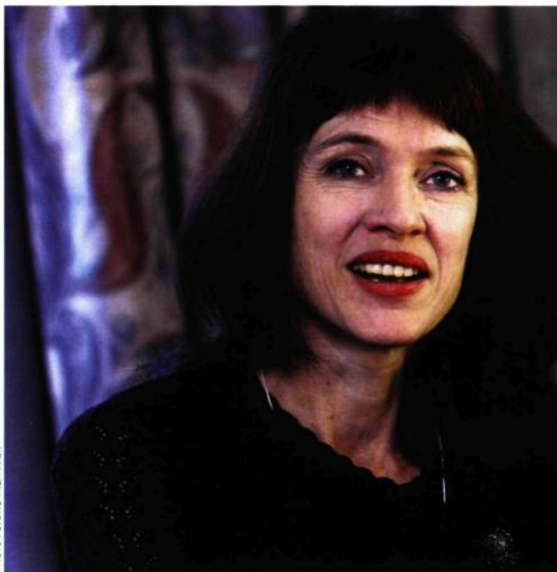
Nancy Huston : « Je suis toujours émue de voir ces lecteurs assidus me suivre roman après roman. »

Nancy Huston est à la fois intellectuelle et romancière, car, bien que l'on s'en étonne encore, les deux sont tout à fait conciliables. Mariée à l'écrivain d'origine bulgare Tzvetan Todorov — prestigieux théoricien de la littérature que tout étudiant universitaire en lettres a fréquenté —, Nancy Huston est mère