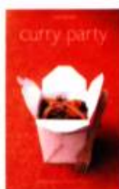
CURRY PARTY Jody Vassallo Photographies de Deirdre Rooney Éd. Marabout, 2004