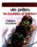
VITE PRÊTES, LES BOULETTES ET LES GALETTES! Catherine Lacouberie Éd. Albin Michel, 2004