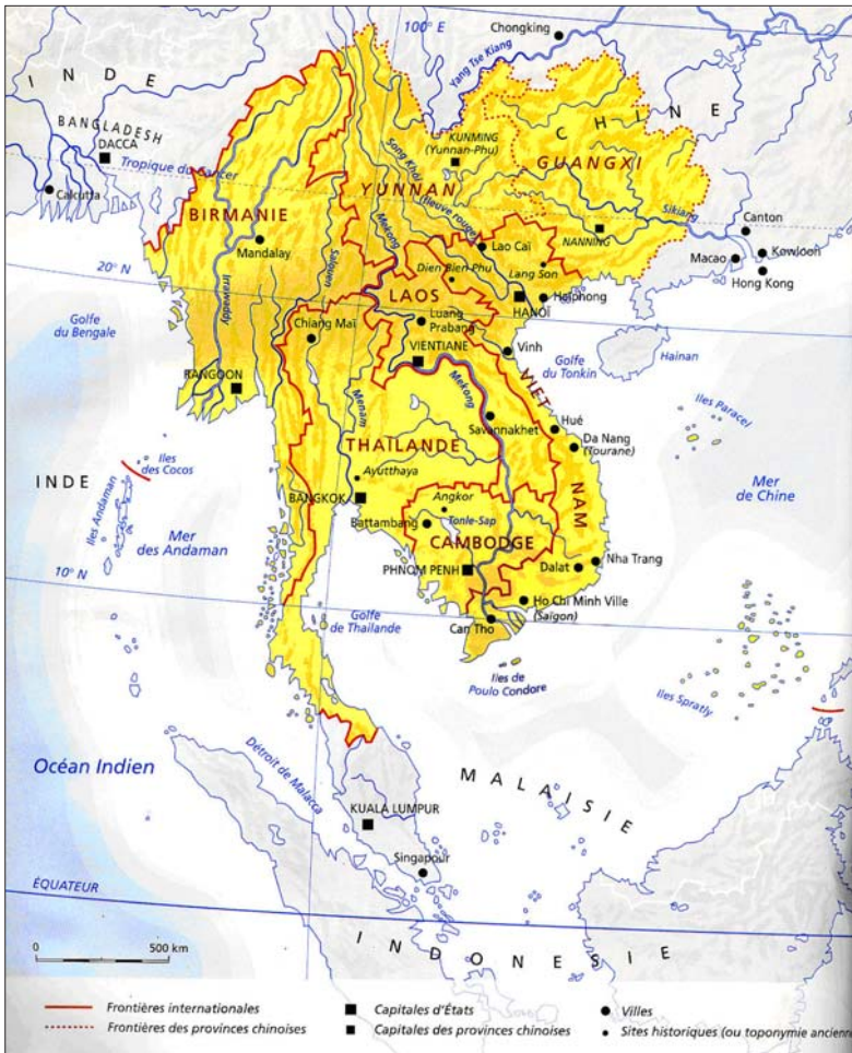
Carte 2 La région du Grand Mékong

sur l'objectif de stabilité comme préalable indispensable à la reconstruction économique, aucune solution ne se fait jour. En 1983, lors d'une conférence de la Commission du Mékong, des tirs sont échangés de part et d'autre du Mékong, à la frontière entre la Thaïlande et le Laos. Les Laotiens se défient des Thaïlandais mais ne peuvent compter, dans leur différend avec leur puissant voisin, que sur le soutien des Vietnamiens. Ironie de l'histoire, c'est de ce petit pays enclavé, qui compte parmi les plus pauvres de la planète, qu'émerge un début de solution, qui est donc le point de départ du plan de développement de la péninsule. Les projets hydroélectriques du Laos dès les années soixante, avec le barrage de Nam Ngum dont une large partie de la production électrique est destinée à la Thaïlande, ne seront jamais interrompus.