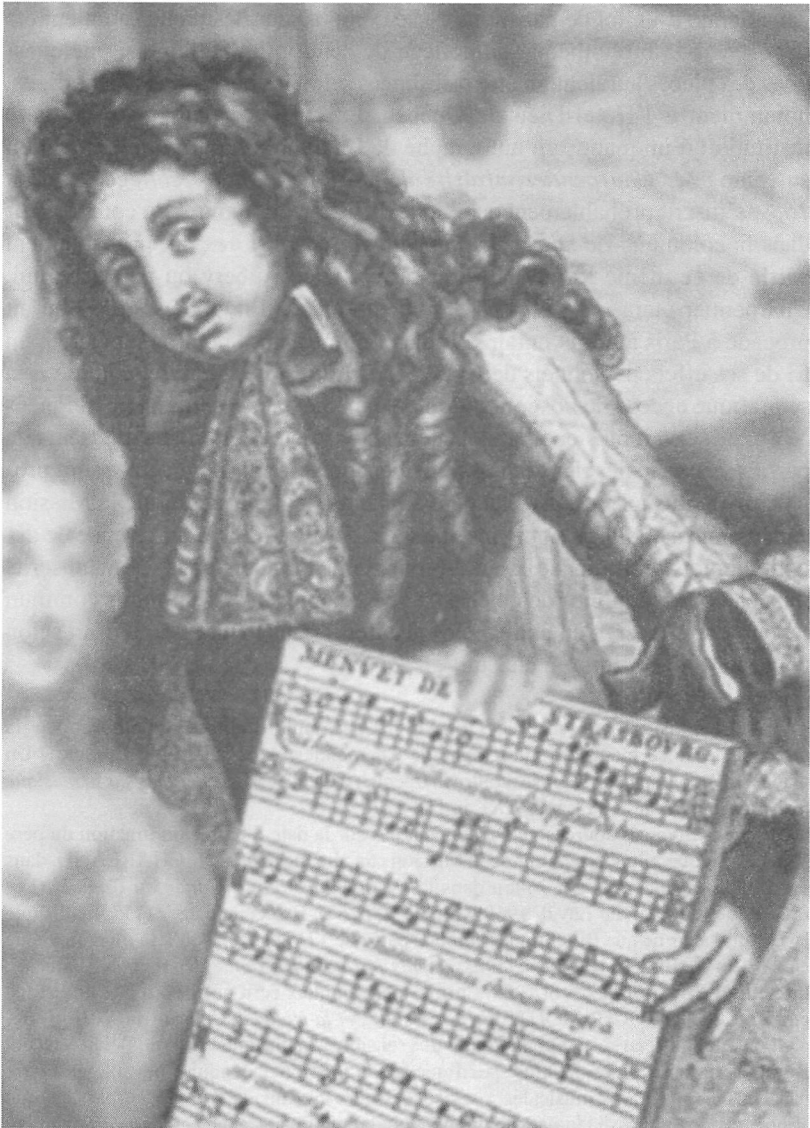
M.-A. Charpentier, Almanach royal de 1682 , Bibliothèque nationale de France.

Loin d'être unique, il est vrai, l'exemple de l'adaptation de cette Chanson des Bergers pour les Sauvages de la Nouvelle-France offre néanmoins un cas témoin exceptionnel d'un ensemble de pratiques sociomusicales signifiantes. Déconstruire, remodeler, réharmoniser, toutes ces actions conscientes posées par les musiciens montrent combien la pratique musicale du temps sait