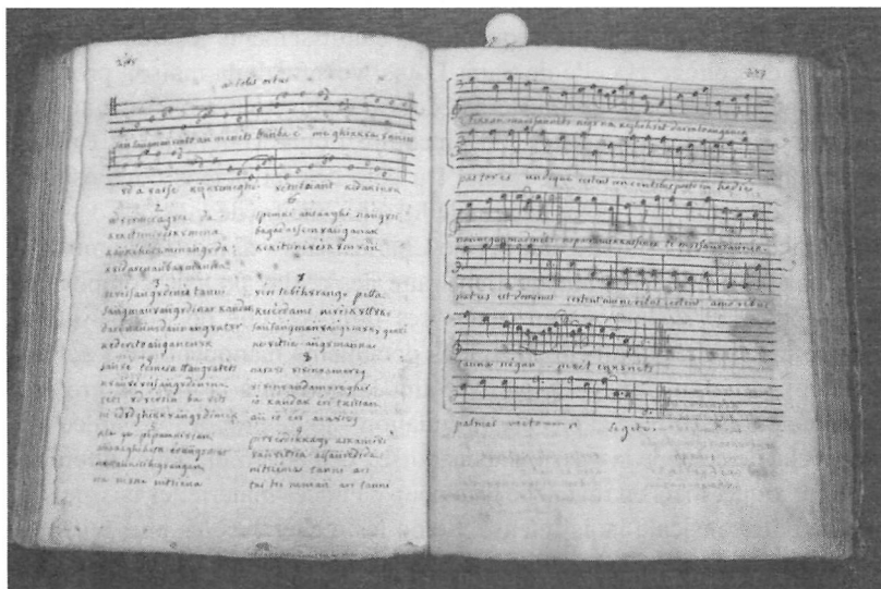
M.-A. Charpentier, Chanson des bergers , C.-F. Virot, manuscrit abénaquis, Archives de l'archidiocèse de Québec.

contenue à la page 289 de ce dernier manuscrit 8 . L'oratorio dont est tirée cette Chanson des Bergers n'ayant jamais été publié en France avant une période récente, on doit conclure que l'œuvre est arrivée en Nouvelle-France sous forme manuscrite, mais comment ? Le présent article va essayer de résoudre cette énigme. D'entrée de jeu, l'histoire canadienne de cette Chanson des Bergers de Charpentier semble indissociable de celle de la vocation missionnaire d'Aubery.