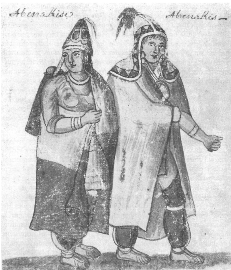
Couple d'Abénaquis. Anonyme, aquarelle, XVIII e siècle