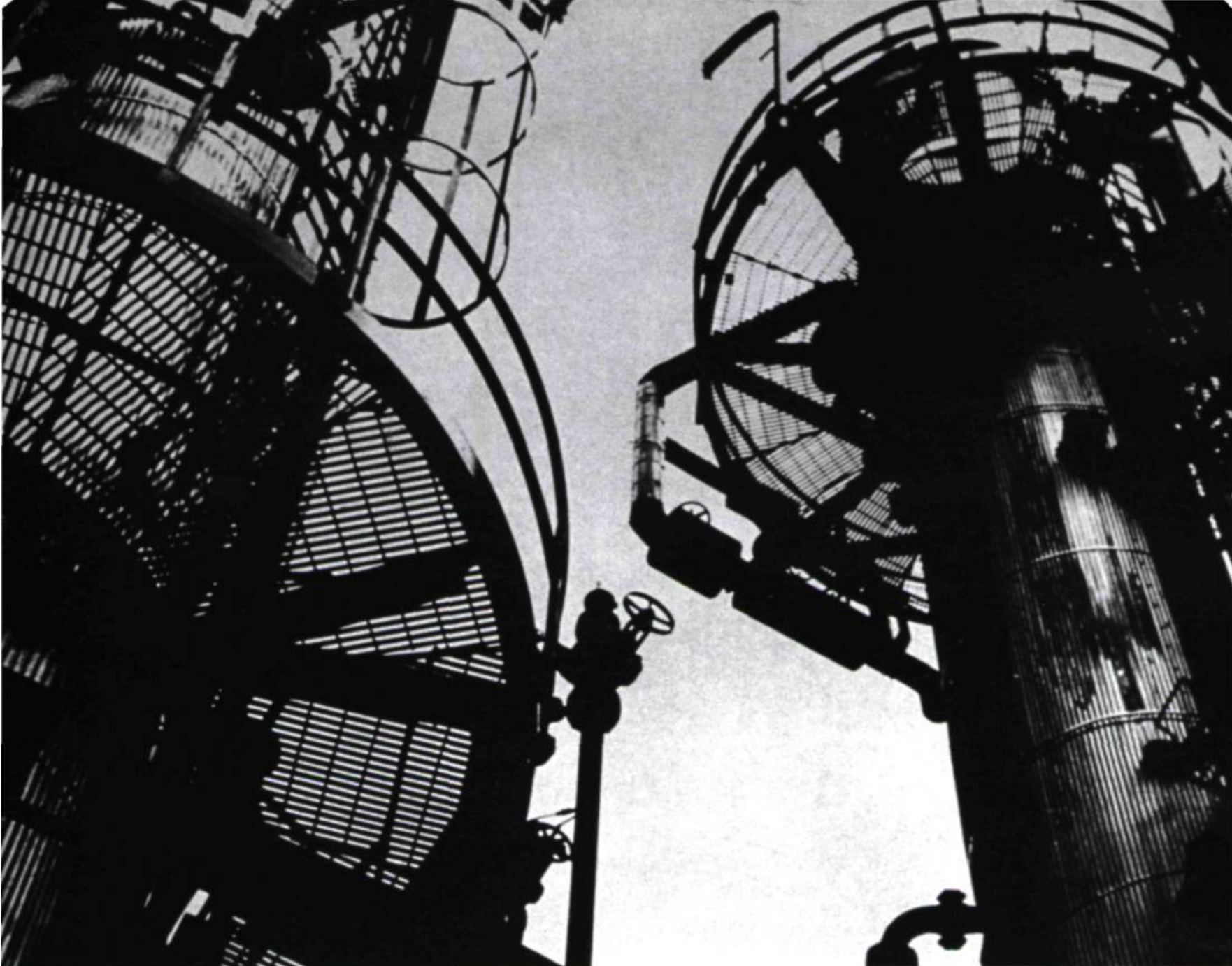
Tours cyanotype sur papier arche 38 x 49 cm 1998