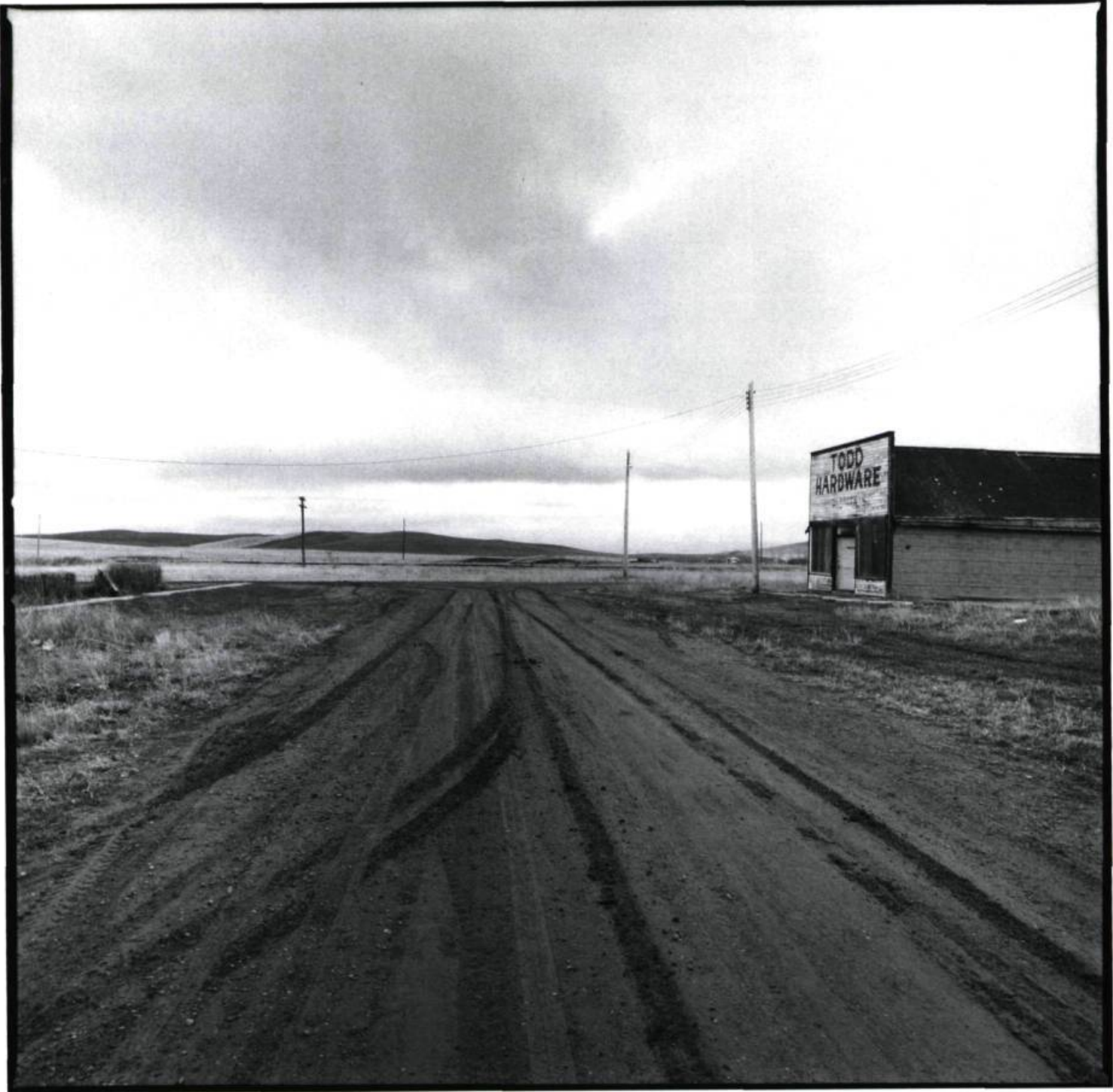
Michichi, Alberta, 1987