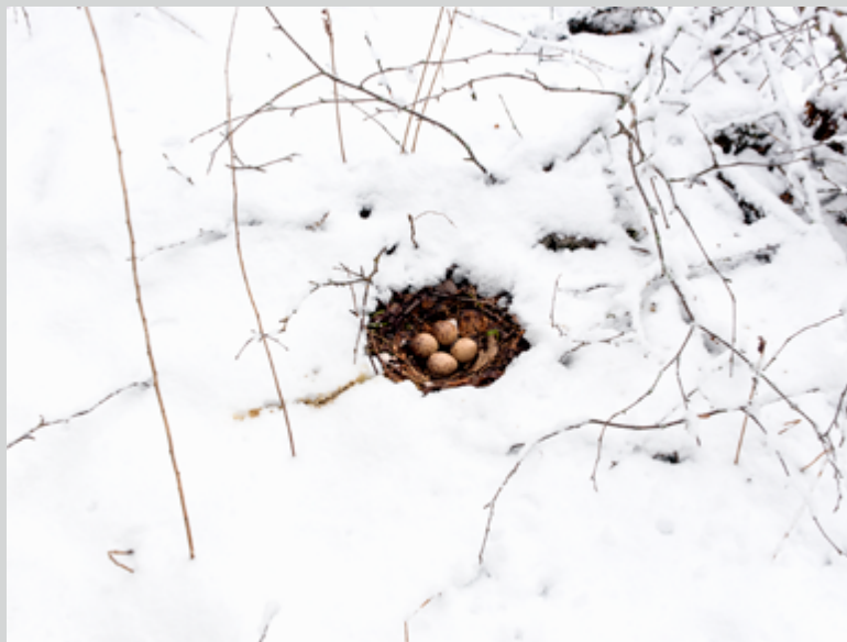
Sans titre , 2015, de la série Lot n° 126 , 81 × 108 cm

— Mona Hakim est historienne de l'art, critique et commissaire indépendante. Ses recherches portent sur divers enjeux liés aux pratiques photographiques contemporaines et actuelles. Elle est l'auteure d'essais et de nombreux textes critiques et monographiques. À titre de commissaire, elle a réalisé plus d'une vingtaine d'expositions, dont deux collectives qui traçaient un portrait synthétique de la photographie québécoise. Elle a enseigné l'histoire de l'art et l'histoire de la photographie au collégial de 1996 à 2015. —