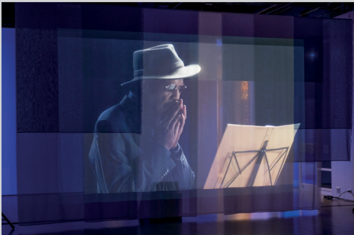
Ultramarine , 2018, installation filmique avec textiles et son, 42 min 46 s, autorisation de l'artiste

dont le bruit évoque les bleus de l'âme, les traumas enfouis... Et, soutenu par ce « talking drum » qui réactive sa mémoire, Kain de décliner, dans son récit fleuve, tous les grands K, venant même à détourner le souvenir violent du KKK... Kain décline aussi tous les bleus, ceux de Prusse, du Bangladesh, d'Outremer... Et le bleu Indigo, « Indigo Blues », celui des champs de coton... Ainsi, Meessen, dans cette exploration sonore et visuelle, parvient-il à capter une expérience sensorielle des flux et reflux de la mémoire enchâssée dans le présent.