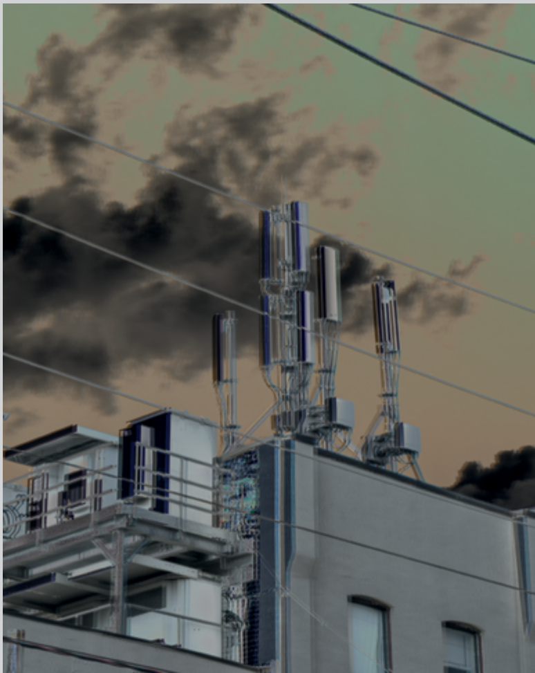
Parallel network no.2, 2016, impression jet d'encre, 91 × 81 cm

de toutes contraintes ou limites physiques découle un enchantement technologique qui tend à faire oublier que cette circulation repose sur une vectorialisation matérielle dont les coûts économiques et écologiques sont loin de s'évaporer.