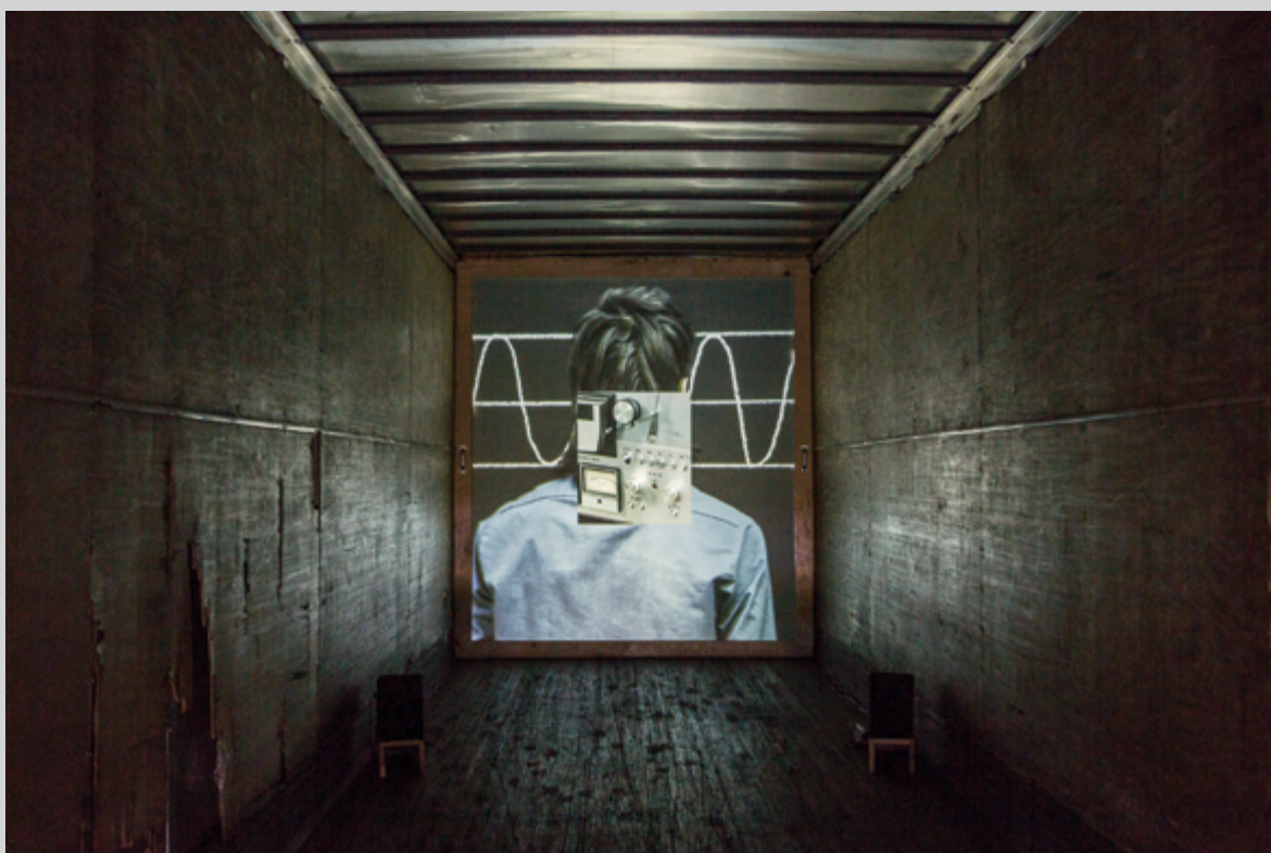
Sébastien Cliche, Le ruban , 2016, installation vidéo HD, en continu avec déroulement aléatoire, intégrée à une remorque de camion, créée pour l'évènement

Sébastien Cliche présente, quant à lui, Le ruban , une pièce réalisée en partie sur place et qui s'inspire de ce que son séjour en ces terres lui a suggéré. Il s'agit d'une projection au fond de la remorque d'un camion. Choix judicieux puisque l'histoire relatée est justement celle de deux personnages pris d'une irrépressible envie de s'aventurer sur la route et qui rencontrent des camions qu'ils vont suivre. Ce ruban peut être celui de la route 132, qui fait le tour de la Gaspésie et dont les habitants et les visiteurs reconnaîtront l'emprise sur la vie de la région. La bande vidéo est composée de variantes d'une durée de 5 minutes 30 secondes, chacune s'ouvrant sur une courte introduction dont