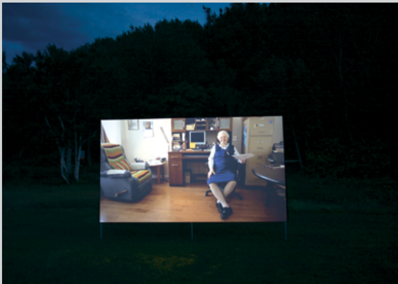
Emmanuelle Léonard, La Providence , 2014, vidéo HD, 29 min

je donne ici quelques exemples : « Dans cette histoire, quelque chose qui est caché ne sera pas révélé », « Dans cette histoire, le monde qui est là, devant nous, n'est pas assemblé », « Dans cette histoire, vous cherchez une façon de recommencer votre vie, mais qui ne dérangera personne ». Lorsque l'histoire reprend, elle est légèrement différente, puisant dans ses cycles alternatifs. Ainsi présentée, elle nous livre ses clefs, le principe de construction que son auteur a établi. L'image est parfois double ; une seconde image, épousant la forme carrée de la surface de projection, mais de plus petite taille, apparaît au centre de la première image. On y voit aussi les personnages au travail, à l'ordinateur et au ruban magnétique, en train de créer l'œuvre qui se déploie sous nos yeux, là, maintenant.