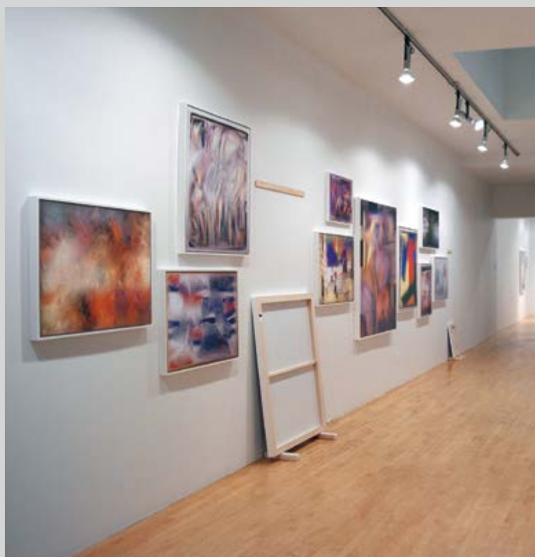
Dépeindre, 2014, vue de l'exposition