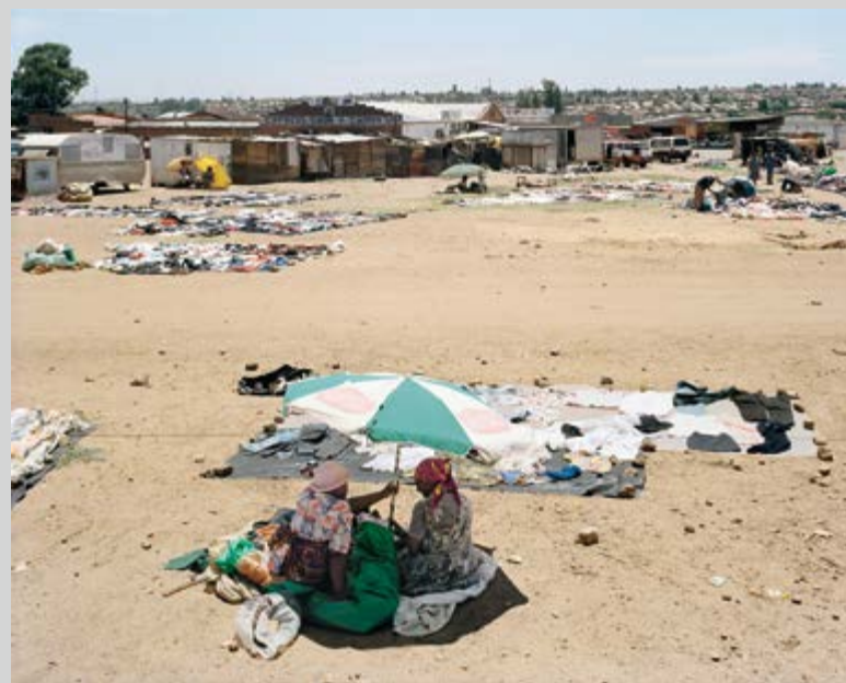
Here, on 26 June 1955, under harassment by the police, some 3000 people from all over South Africa, representing many organisations, adopted the Freedom Charter, which inspired the constitution of post-apartheid democratic South Africa. Freedom Square, Kliptown, Soweto, Johannesburg. 10 December 2003, from the series Structures of Dominion and Democracy , inkjet print, 140 x 173 cm, courtesy of the Marian Goodman Gallery

If Goldblatt sees these buildings and places as expressing the normalization of coercion and corruption as acceptable ways of life, his response is that of photography practised as a means of interruption and denaturalization. His is one of the world's great projects of documentary reportage and, as such, is clearly distinguishable from the interventions of Edward Burzynsky, Alfredo Jaar, and Sebastiao Salgado, whose practices rest on pictorial