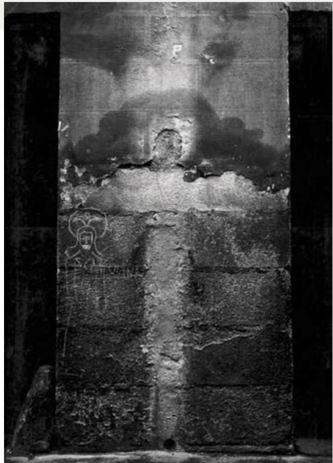
Paco Gómez Martínez, Cristo , 1959

Anonymous / Anonyme, Actriz Adelaida Fernández Zapatero, 1859