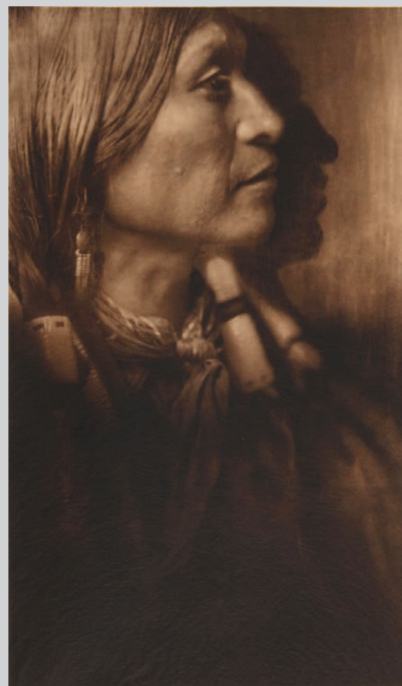
Vash Gon – Jicarilla , 1904, photogravure sur papier japonais Gampi

Edward S. Curtis fut influencé en son temps par le « pictorialisme » (1885-1915), un mouvement lié à l'usage de ce nouveau procédé dit « à plaque sèche » et aux manipulations (retouches, filtres et papiers spéciaux) autorisées afin de rapprocher la photographie de l'art de la peinture et de l'eau-forte. Le Camera Club de New York (1896) et le photographe Alfred Stieglitz en sont des références américaines. Néanmoins, malgré les mises en scène paysagistes et les portraits de nombre d'Amérindiens costumés, c'est davantage