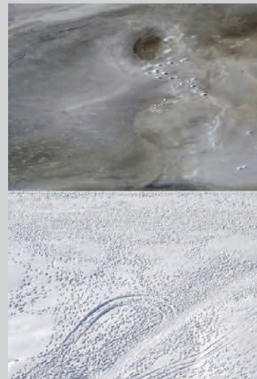
Verglas, 2012, impression à jet d'encre, 106 x 77 cm

Somme toute, l'exposition Bribes porte très bien son nom ; ce sont, en effet, des bouts de paysage qui y sont présentés, des « éclats » de lieux, rapiécés, créant un nouveau tout, plus près du ressenti que du montré. Et parmi cet ensemble d'œuvres dont la manipulation et la transformation du paysage par l'homme constituent le moteur, certaines images nous happent, d'autres nous questionnent. C'est dire que, malgré la rupture avec la tradition photographique, la sensibilité trouble que ces lieux suscitent et leur inquiétante beauté amènent sûrement à une certaine contemplation.