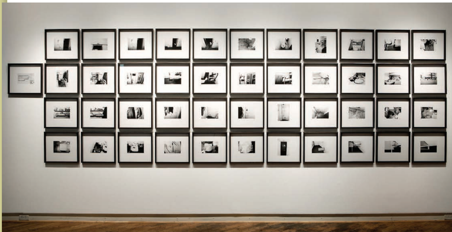
Homicide, détenu vs détenu, archives du Palais de justice de la ville de Québec, 2010, vue de l'exposition / exhibition view, 45 impressions jet d'encre / inkjet prints, 37 x 33 cm chaque / each

du statut de l'archive. La manipulation et le déplacement des photographies transforment les documents administratifs en œuvres accessibles au grand public. Les photographies des traces censées attester du drame sont désormais évaluées à l'aune de critères esthétiques, altérant leur valeur originelle d'enregistrement et d'empreinte. Si la réappropriation du corpus implique une forme de repli de l'artiste, ce retrait est compensé par la valeur conceptuelle du projet, le choix du sujet dans les archives et la disposition des tirages dans l'espace de la galerie.