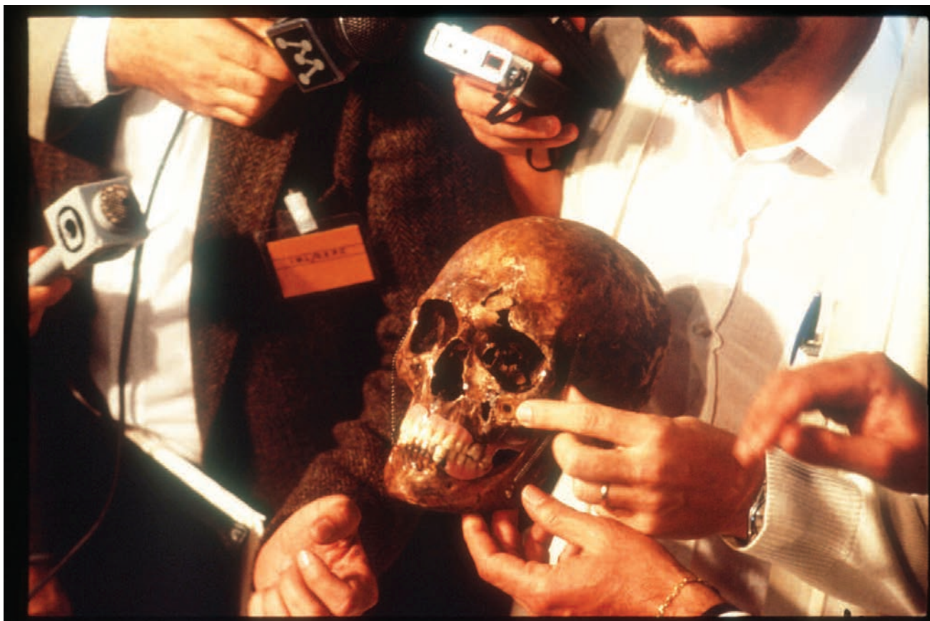
Robert Nickelsberg, The Body of Mengele , 1985, source : Liaison, Getty Images *