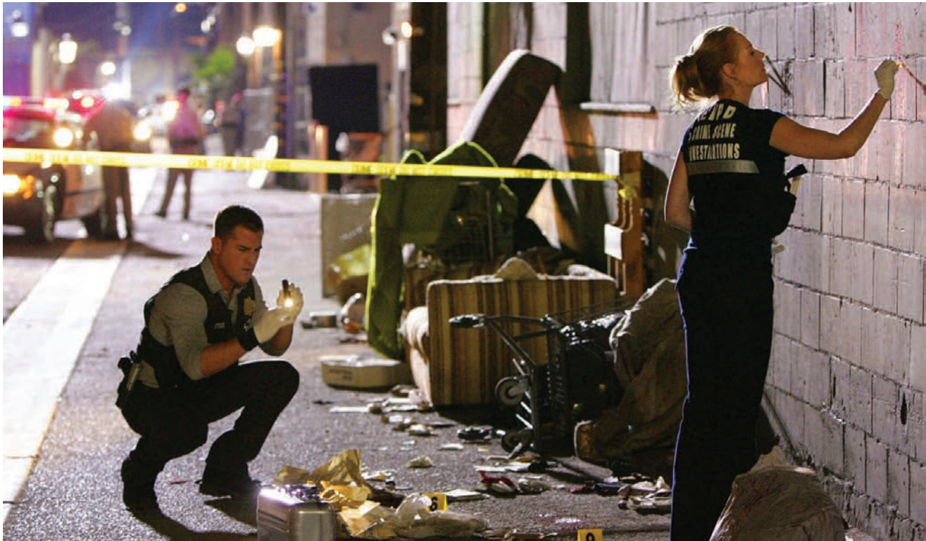
Série télévisée / TV series Les Experts / CSI (Crime Scene Investigation) – Las Vegas, épisode 10.06 : Death & the Maiden , 2009, photo : Sonja Flemming / CBS. © CBS BROADCASTING INC.

"Forensic." Our affinity for evidentiary systems that purvey incontestable truths has as an emblem the word forensic . 6 Disciplines engaged in criminal inquiries are now tagged with this term: forensic anthropology, forensic linguistics, forensic entomology, forensic botany, and so on. The addition of this qualifier is revealing of the turn to forensics that these sciences and disciplines have taken in recent decades. For instance, forensic anthropology, to take an example popularized by the television series Bones (première 2005), refers to the legal applications of this discipline in the human sciences. Using the methods of