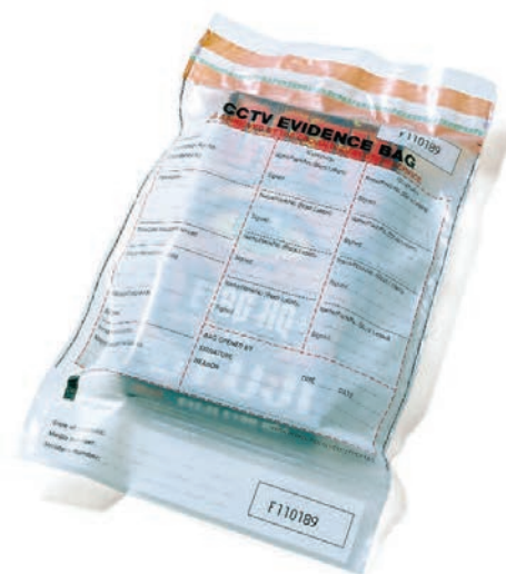
Fujifilm, CCTV (vidéo surveillance en circuit fermé / closed-circuit television), sac pour pièces à conviction / evidence bag

The project undertakes research that maps, images, and models sites of violence within the framework of international humanitarian law and human rights. Through its public activities it also situates forensic architecture within broader historical and theoretical contexts 9 . » Les méthodes de recherche de la « forensic architecture » sont les suivantes : missions conduites sur des sites politiquement sensibles (Libye, Gaza, Guatemala, Pakistan, etc.), relevés effectués au moyen de technologies de surveillance – imagerie satellite, données GPS, radar à pénétration de sol –, collectes d'imageries médiatiques alternatives (téléphonie portable, journalisme citoyen), interviews de témoins. Destinées à recueillir des informations, ces recherches procèdent de l'enquête de terrain ( field ). Ces travaux d'investigation