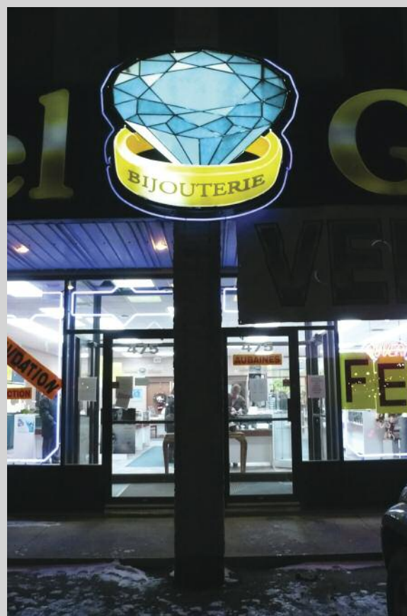
Emmanuel Galland, TOTEMS 14 , 2012, série de 22 photographies, impression jet d'encre

de vue (légèrement en plongée), les scènes extérieures ont été captées par les neuf caméras de l'automobile de Google et ont annexé certains fragments de vie au site Google Street View. Elles ont été découvertes par l'artiste, après de nombreuses heures de recherches sur le site Web. Pour trouver des situations, des coïncidences, des anecdotes, Rafman parcourt virtuellement les millions de kilomètres que la voiture de Google a sillonnés physiquement. Rafman s'approprie ensuite ces images empruntées au géant d'Internet et met ainsi en relief différentes problématiques du monde que la voiture a permis de saisir. Travaillant à la fois sur l'immensité du territoire et sur l'anecdotique, Rafman nous propose certaines scènes dérangelantes, d'autres poétiques, quelques-unes même amusantes. Il cherche minutieusement un moment marquant ou un paysage pour devenir, comme il le dit si bien, tour à tour photographe du moment décisif à la Cartier-Bresson ou photographe de paysage. En recadrant avec précision les prises de vue du lieu ou de la scène choisis, en s'appropriant les images, il devient alors lui-même