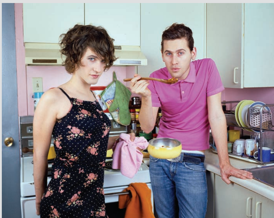
Untitled 1 & 3, 2007, de la série / from the series Alone Time , 2007-2009, impression jet d'encre / inkjet print, 43 x 56 cm