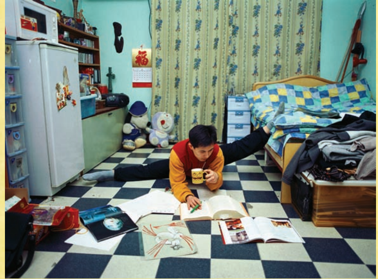
黄豆豆 (上海籍 舞蹈家) 我现在团里担任艺术总监、编导、主演, 工作非常地繁忙。 平时连练功的时间都没有, 只能边工作边练功, 节省时间, 一举二得。希望能出国去进修现代舞的编导, 在业务上再提高一步。要说痛苦, 那就是我现在没有正常人的生活。