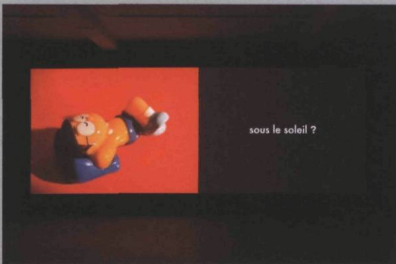
Le plan de la ville , 2006, installation vidéo, dimensions variable.

Cet enseignement dispensé par le temps, Henricks nous le décline à son tour à travers différentes métaphores – la ville, le corps, le bâtiment – qui elles-mêmes s'enchaînent. La ville prend la forme de cartes géographiques et de ruines romaines, de buildings et de graffitis. Ainsi, à la phrase