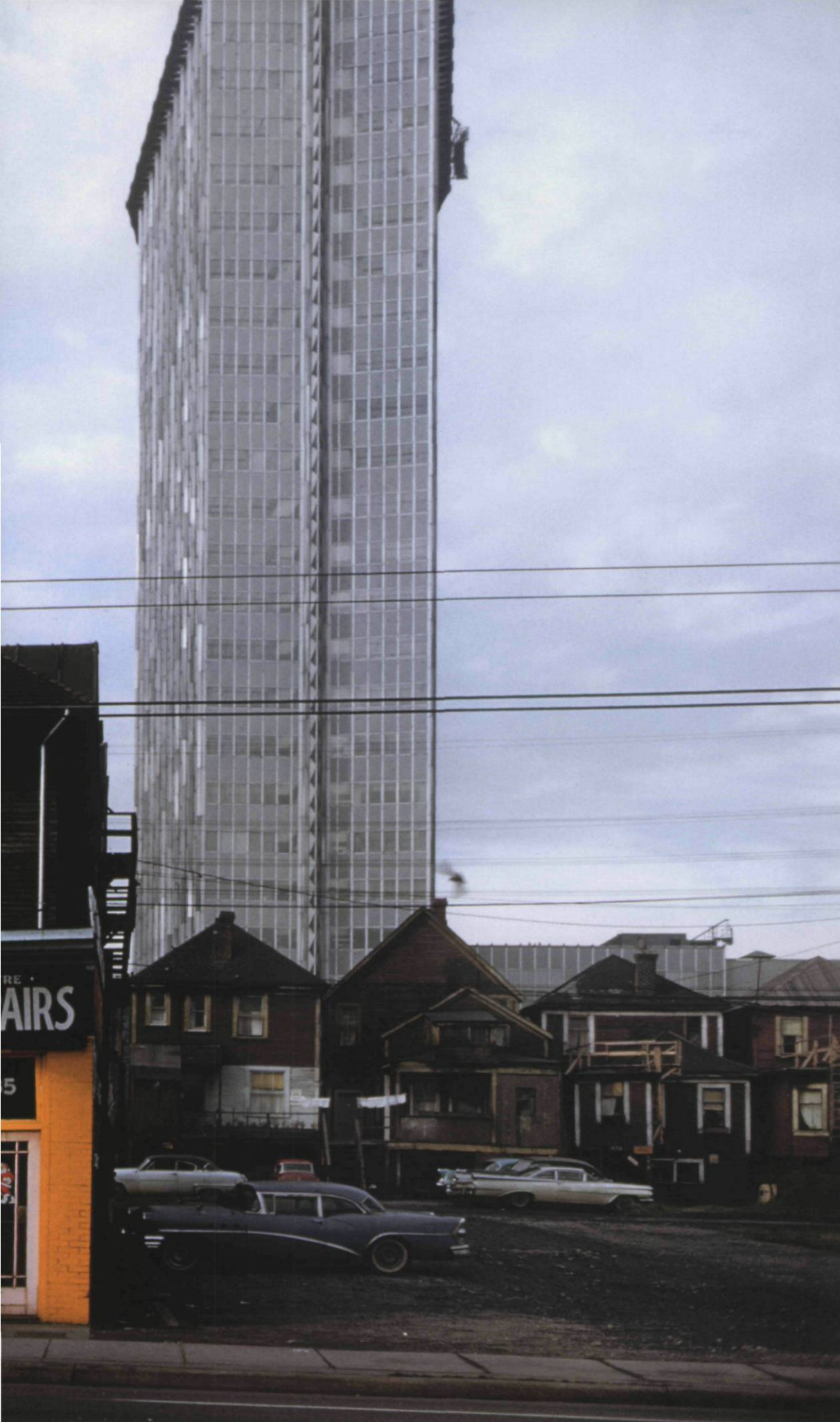
Howe and Nelson, 1960

ALL IMAGES/TOUTES LES IMAGES Impressions jet d'encre / Inkjet prints 50,8 x 76,2 cm et 76,2 x 50,8 cm