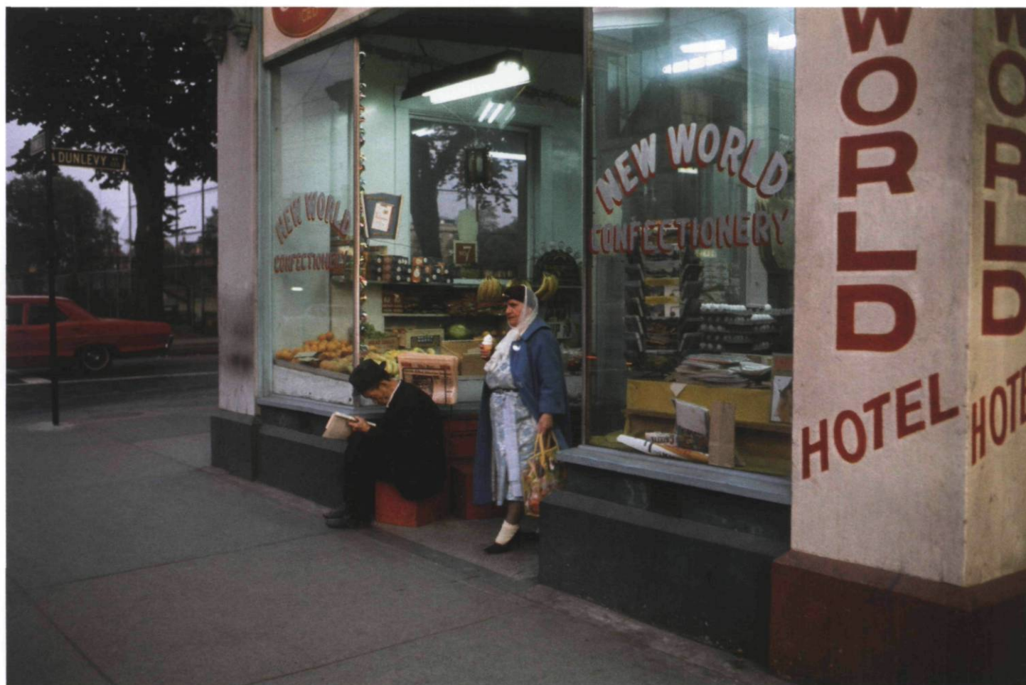
New World Confectionery, 1965

For more than fifty years, Fred Herzog has roamed the streets of Vancouver. His camera dwells on the raw fabric of the city: second-hand stores, restaurants, storefront windows, barbershops, and vacant lots, and the people using those spaces. The selection of images presented here stems from a body of work that comprises hundreds of images. All of these works share a bold and innovative use of colour and attest to the artist's interest in human interactions within mutating cityscapes.