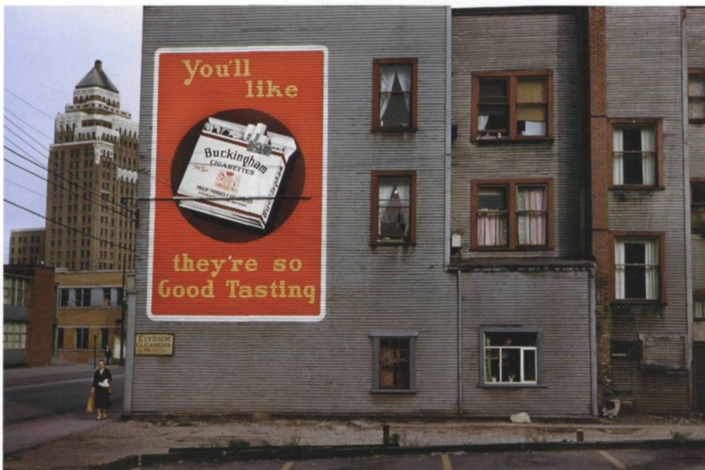
Elysium Cleaners, 1958