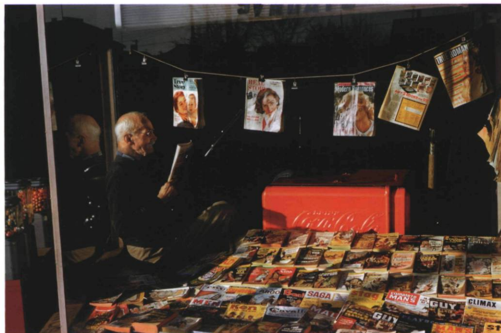
Magazine Man, 1959