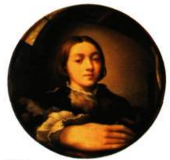
Fig. 2 Parmigianino Autoportrait au miroir convexe huile sur bois diamètre 24,4 cm 1523-1524 Vienne, Kunsthistorisches Museum