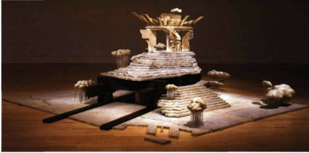
Fig. 1 Pierre Granche Gravité/Cité/Ennuagé marbre, acier, bois aggloméré, papier mâché et plâtre 155 x 575 x 480 cm 1988 Coll. Musée national des beaux-arts du Québec 2000.364