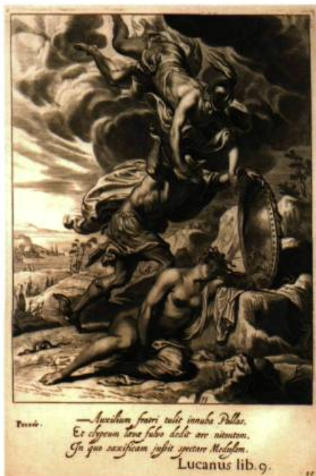
Fig. 6 Persée décapite Méduse gravure tirée de Tableaux du Temple des Muses 1655 collection de l'auteur

Alain Laframboise poursuit une recherche artistique sous forme de montages tridimensionnels (ses boîtes) et de photographies qui explorent les mécanismes de la représentation. Il enseigne également l'histoire et la théorie de l'art à l'Université de Montréal. Il est représenté par la Galerie Graff à Montréal. Ses œuvres figurent dans de nombreuses collections publiques.