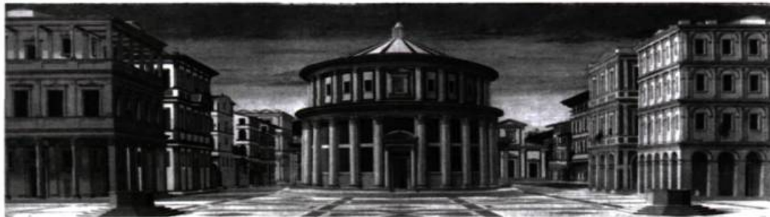
Fig. 5 attribué à Piero della Francesca La cité idéale panneau dit d'Urbino Galerie nationale des Marches