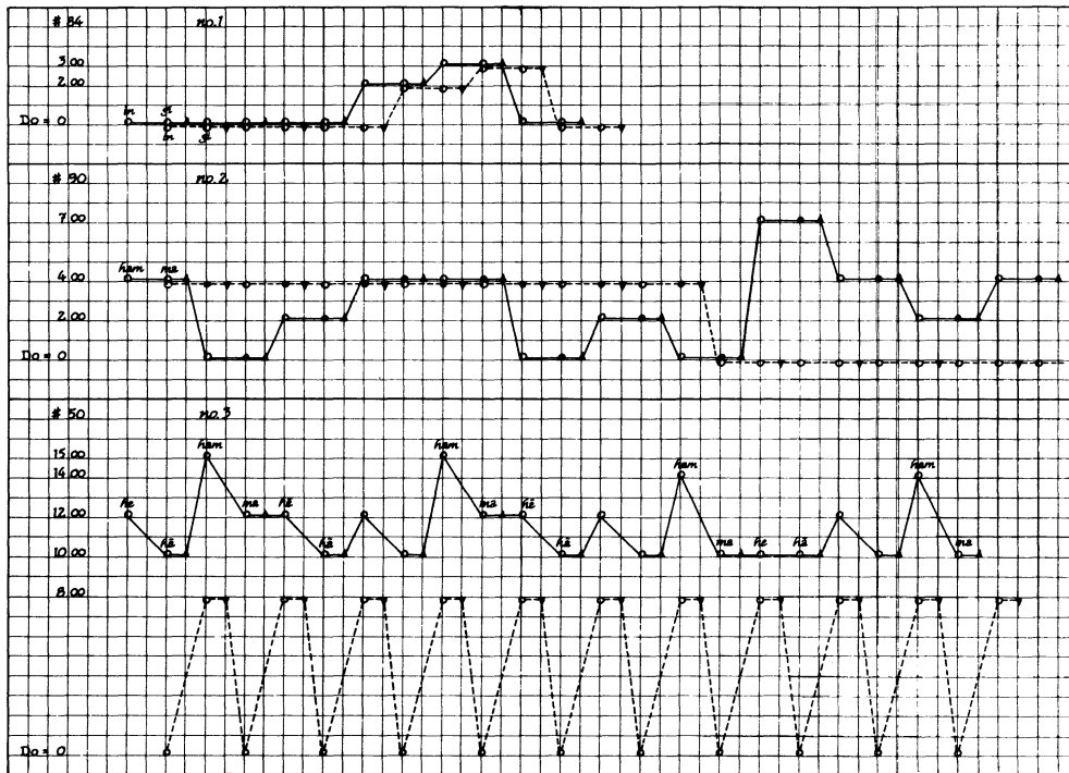
Tableau II (a)