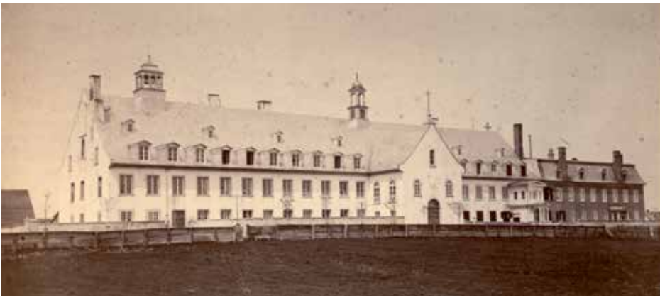
À l'origine, l'aile Saint-Joseph (à droite) se démarque de l'ensemble conventuel. Vers 1896, son mur donnant sur la rue sera enduit de crépi et blanchi à la chaux pour s'harmoniser au reste de la façade.