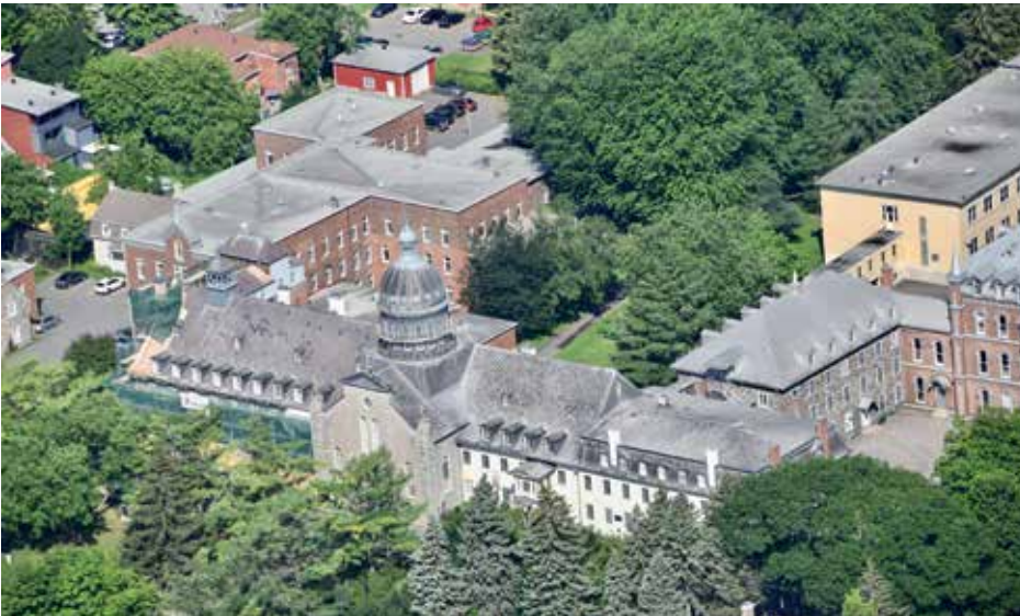
Site du monastère des Ursulines de Trois-Rivières, au départ des religieuses à l'été 2019

Photo : L. Grenier, Collections et archives | Pôle culturel du monastère des Ursulines, MTR/2/1/20,1-5