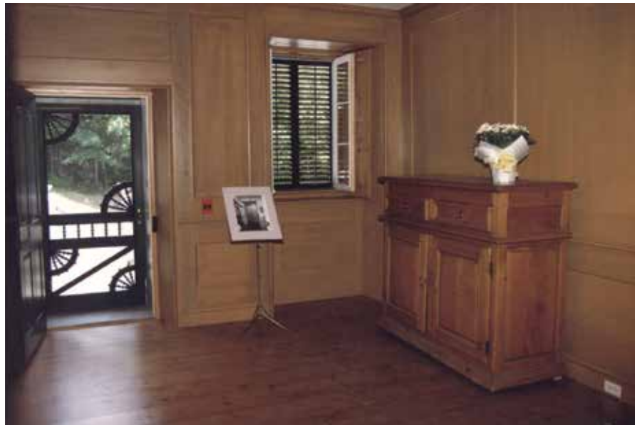
Maison des Jésuites-de-Sillery

L'escalier de la maison Maizerets, fabriqué de bouleau jaune (merisier), de frêne blanc et de pin blanc, est massif et autoportant. Il est dit « à la française », avec ses limons rainurés à élégis, ses barrotins à double balustre de même que sa structure et son garde-corps assemblés à tenons et mortaises