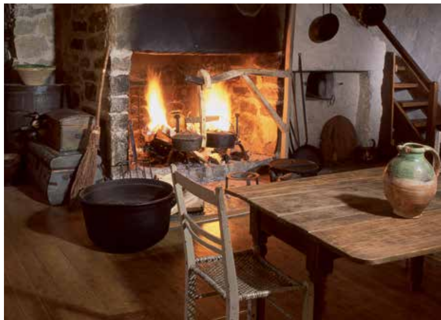
Maison Charles-Genest