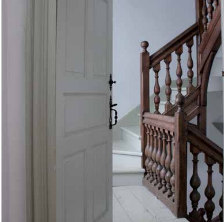
Maison Maizerets

chevillés. Il comprend aussi une plinthe entaillée du côté mur et des poteaux aux extrémités ornementées de pommeaux et de pendentifs. (AL)