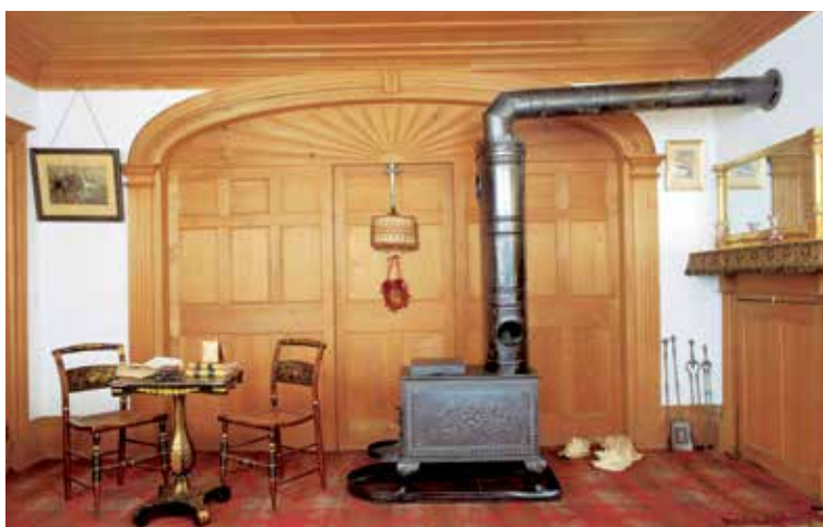
Maison Moreau-Pelletier

Dans la maison Moreau-Pelletier, qui servira de résidence d'été à un notable de Québec, la finition des intérieurs s'ajuste aux canons de l'Antiquité : on y fait chanter le pin dans une grammaire décorative toute classique. Les feux fermés (poêles, cuisinières, etc.) sortis de nos fonderies locales ont alors conquis la population, et le mobilier s'inscrit dans la mode du temps. Au plan ouvert des demeures d'esprit français succède le plan symétrique, où l'espace intérieur se divise en deux sections, l'une comprenant les pièces fonctionnelles fermées et l'autre, celles d'apparat. Enfin, le salon double de la maison Moreau-Pelletier témoigne du raffinement croissant de la société. La Côte-du-Sud, en particulier, verra apparaître des intérieurs dont la menuiserie présente une richesse et une finesse décoratives indéniables. (ML)