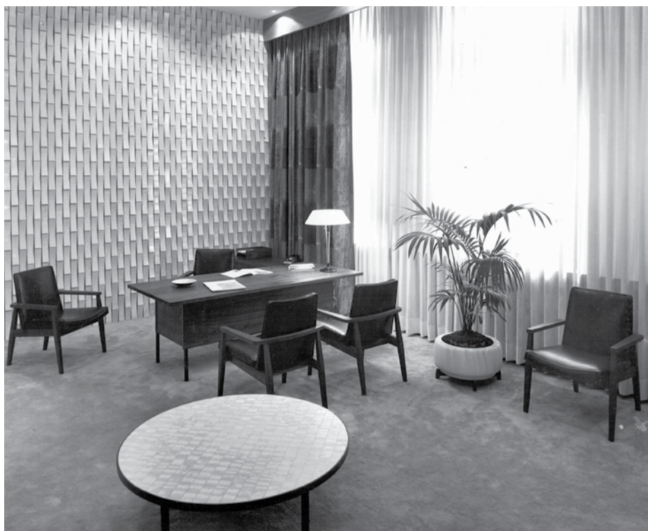
On doit aussi à Julien Hébert le design du mobilier d'inspiration scandinave Grébert.

Pour Julien Hébert, le design ne servait pas à vendre des meubles de luxe à une élite dépensière, mais à créer des objets adaptés aux besoins de la société.