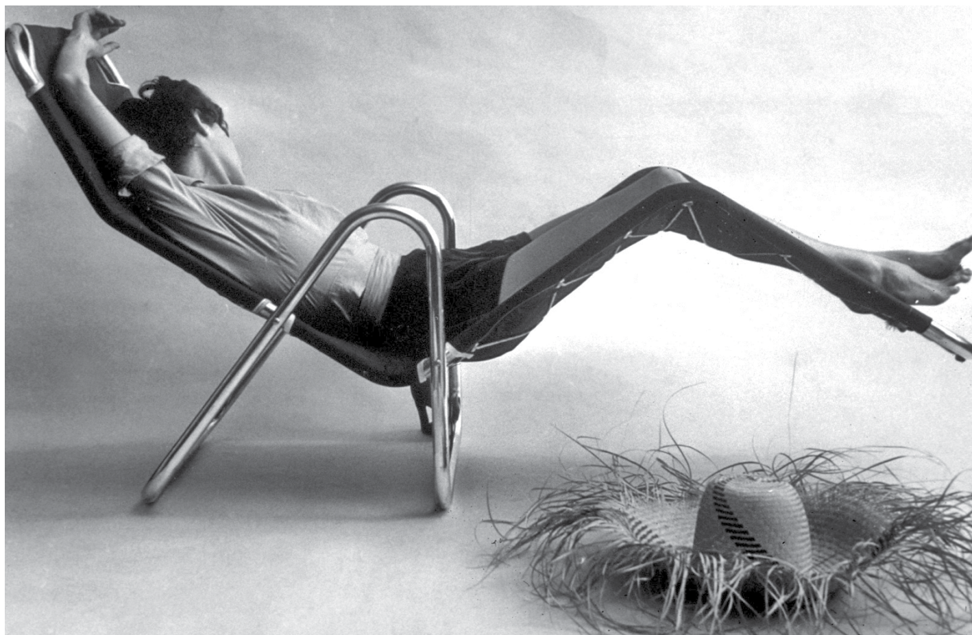
Avec la création de la chaise longue Contour, en 1953, le design canadien fait son entrée sur la scène internationale.

Pour Julien Hébert, ce travail ne servait pas à vendre des meubles de luxe à une élite dépen-sière, mais à créer des objets adaptés aux besoins de la société. En 1971, il avait même élaboré un plan pour revitaliser les régions en formant au design les chômeurs québécois! Cette conception engagée du métier subsiste à Concordia, où les futurs designers mènent des projets à portée sociale, notamment pour l'organisme Dans la rue.