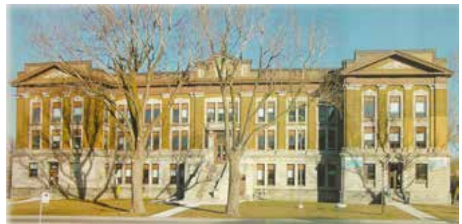
École Irène-Lussier, Montréal

www.histoirequebec.qc.ca sous l'onglet magazine