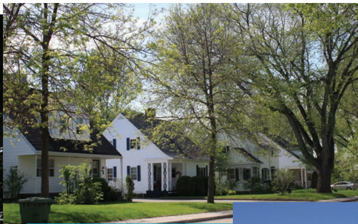
▲ Dans la cité-jardin d'Arvida, ville de compagnie, les maisons unifamiliales sont issues d'un répertoire comprenant plusieurs modèles architecturaux pour créer des paysages variés.