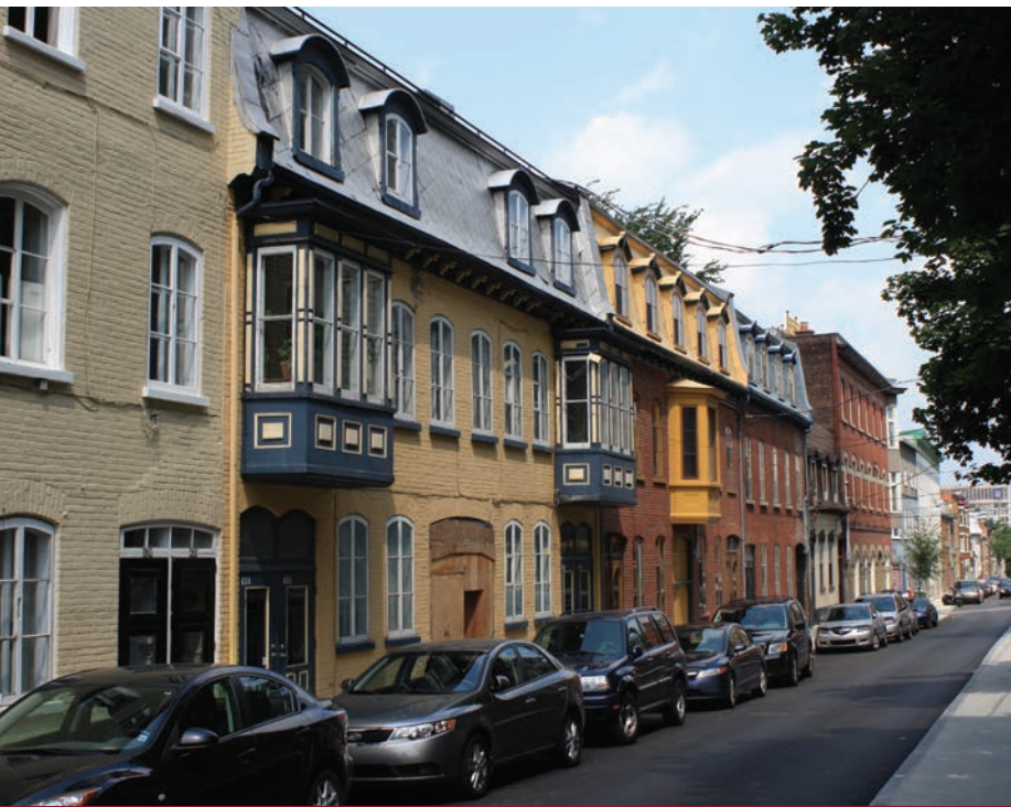
Le faubourg Saint-Jean, à Québec, est caractérisé par des immeubles mitoyens en brique implantés sur le trottoir et dotés de portes cochères permettant d'accéder aux cours arrière, qui ne sont pas desservies par des ruelles.